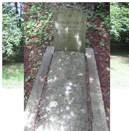
KZ-Friedhof und Gedenkstätte Türkheim.