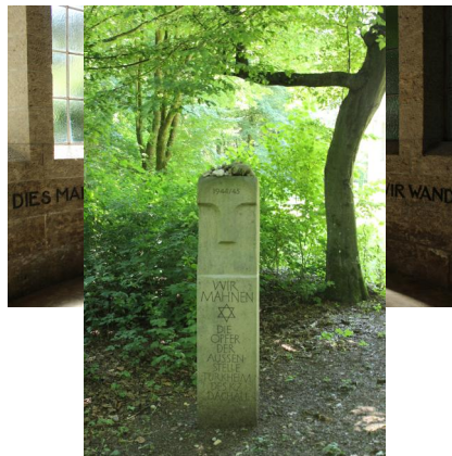
KZ-Friedhof und Gedenkstätte Türkheim