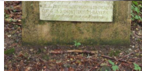
KZ-Friedhof und Gedenkstätte Türkheim.