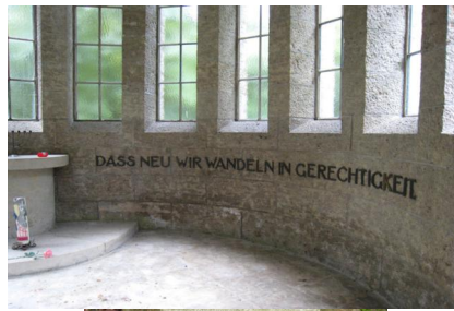
KZ-Friedhof und Gedenkstätte Türkheim.