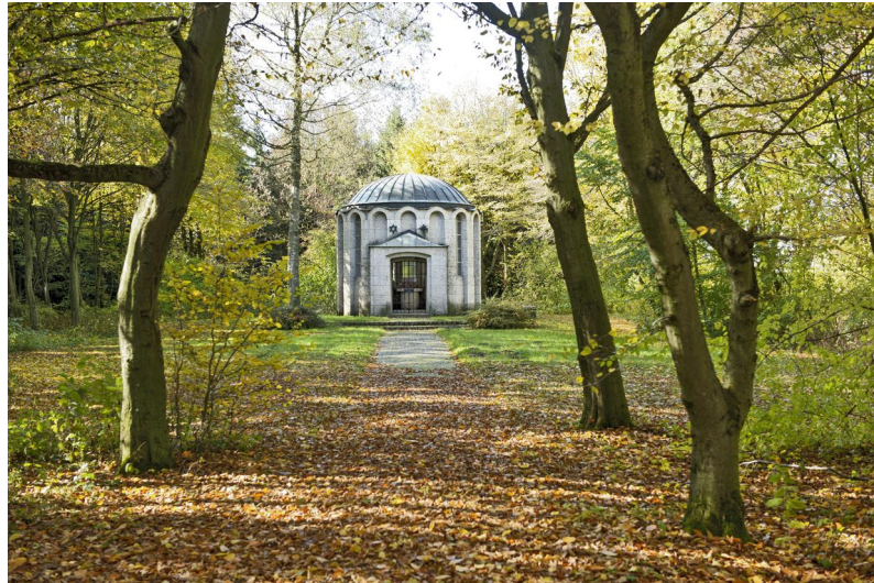
KZ-Friedhof und Gedenkstätte Türkheim

Der KZ-Friedhof liegt westlich des Ortes am Wald, der Weg ist ausgeschildert (Doktor-Viktor-Frankl-Weg 99). Der Friedhof entstand im Zusammenhang mit Opfern aus Lager VI des KZ-Außenlagerkomplexes Landsberg/Kaufering, die nahe des Lagers verscharrt worden waren und nach der Befreiung des Lagers am 8. Mai 1945 durch US-Truppen im Wald entdeckt, exhumiert und in der heutigen Anlage beigesetzt wurden. 1950 erfolgte die Ausgestaltung des Friedhofs, 1959 die Verglasung der Fenster im Ehrentempel und die Deckung der Kuppel mit einem Kupferdach, die 1970 erneuert wurde. 1977/78 erfolgte eine Neugestaltung der Anlage.