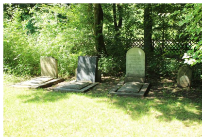
KZ-Friedhof und Gedenkstätte Türkheim