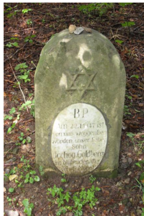
KZ-Friedhof und Gedenkstätte Türkheim.