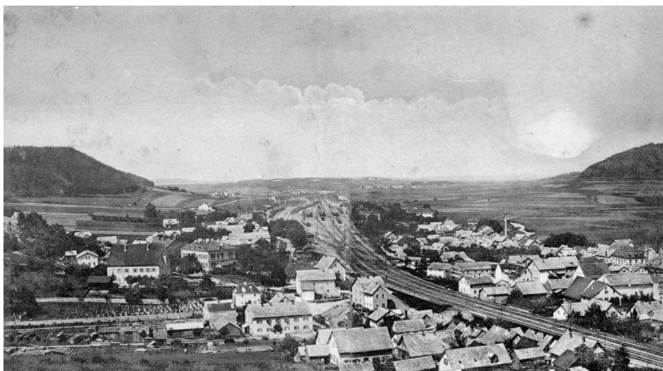
Postkarte „Treuchtlingen“, Gesamtansicht, im Vordergrund links der jüdische Friedhof.

Der jüdische Friedhof liegt am Fuße des Schlossberges in einem Wohngebiet an der Uhlbergstraße. Er hat eine Fläche von über 4000 qm und wurde nach 1773 angelegt. Es sind noch über 300 Grabsteine erhalten.