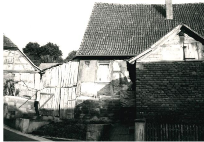
Außenansicht des Gebäudes der ehemaligen Synagoge (Aufnahme 1987).