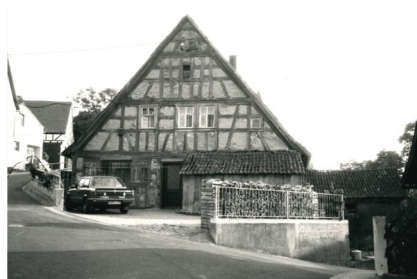
Sogenannte Ritterschule, ehemalige Schule für adelige Kinder bis Mitte 17. Jh., bis 1680 Vogtei, 1680-1847 Pfarrhaus und jüdisches Wohnhaus, danach auch Synagoge bis 1887