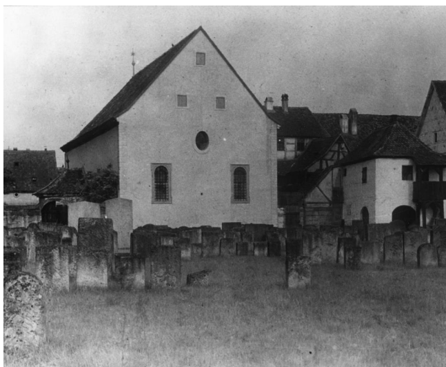
Die 1711 erbaute Synagoge von Baiersdorf, Außenansicht von Südosten; im Vordergrund der jüdische Friedhof (20.7.1927).