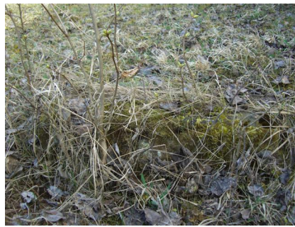
Jüdischer Friedhof Sulzdorf a. d. Lederhecke, März 2010.