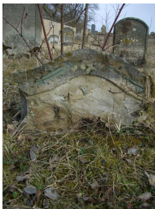
Jüdischer Friedhof Sulzdorf a. d. Lederhecke, März 2010.