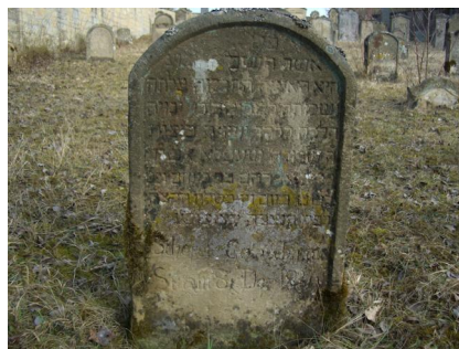
Jüdischer Friedhof Sulzdorf a. d. Lederhecke, März 2010.