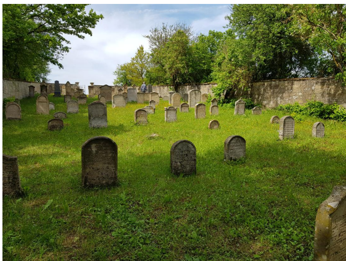
Jüdischer Friedhof Sulzdorf a.d. Lederhecke, 2021.

Der jüdische Friedhof liegt etwa 700 m westlich von Sulzdorf a.d.L. inmitten von Feldern. Er hat eine Größe von 1670 qm. Die erste Beerdigung war 1832. Etwa einhundert Grabsteine sind noch erhalten. Die letzte Beisetzung war 1905.