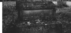
Jüdischer Friedhof Sulzdorf.