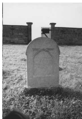
Jüdischer Friedhof Sulzdorf.