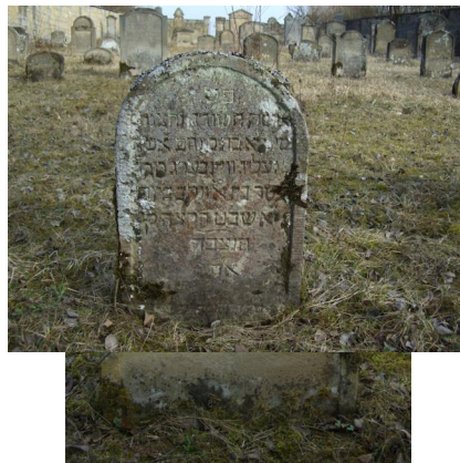
Jüdischer Friedhof Sulzdorf a. d. Lederhecke, März 2010.