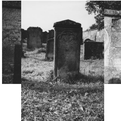
Jüdischer Friedhof Sulzdorf.