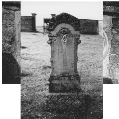
Jüdischer Friedhof Sulzdorf.