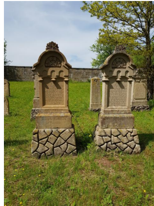
Jüdischer Friedhof Sulzdorf a.d. Lederhecke, 2021.