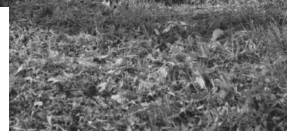
Jüdischer Friedhof Sulzdorf.