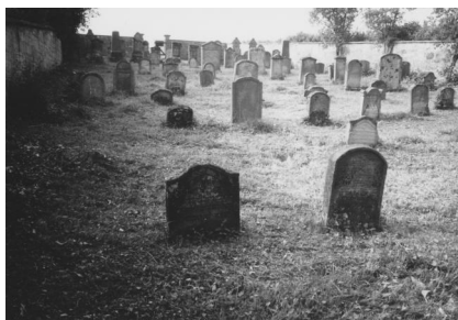
Jüdischer Friedhof Sulzdorf.