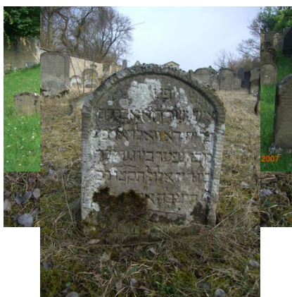
Jüdischer Friedhof Sulzdorf a. d. Lederhecke, März 2010.