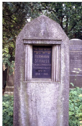
Jüdischer Friedhof Sulzbach-Rosenberg.