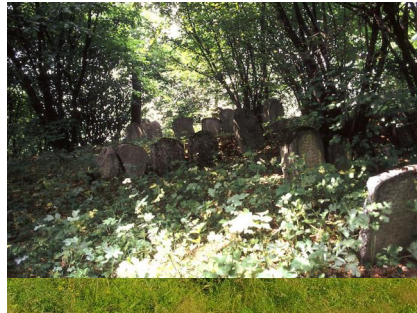
Jüdischer Friedhof Sulzbach-Rosenberg, 2020.

Schändungen: Bereits im 17. Jahrhundert beklagten sich die Juden mehrfach, dass der Holzzaun um ihren Friedhof demoliert wurde; daraufhin genehmigte der Herzog den Bau einer Steinmauer. Weitere Schändungen: 1938 und 1972.