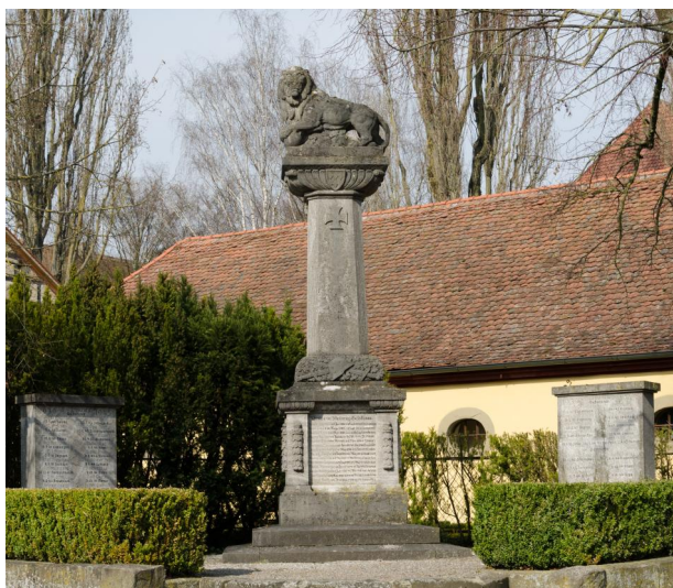
Sugenheim, Denkmal für die Gefallenen des Ersten Weltkriegs.

In Sugenheim steht ein Kriegerdenkmal für die Gefallenen beider Weltkriege vor dem Schloss an der Einmündung in die Hauptstraße. Auf dem mittleren Denkmal, das den Kriegstoten von 1914–1918 gewidmet ist, sind folgende jüdische Gefallene verzeichnet: