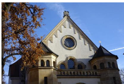
Die Synagoge zu Straubing, erbaut 1907, in: Isaak Mayer, Zur Geschichte der Juden in Regensburg, Regensburg 1913, S. 89

(Text von Guido Scharrer, bearbeitet von Patrick Charell)