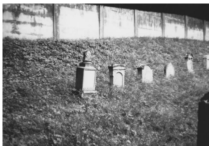
Jüdischer Friedhof Steinach.