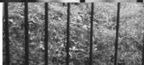
Jüdischer Friedhof Steinach.