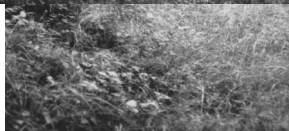
Jüdischer Friedhof Steinach.