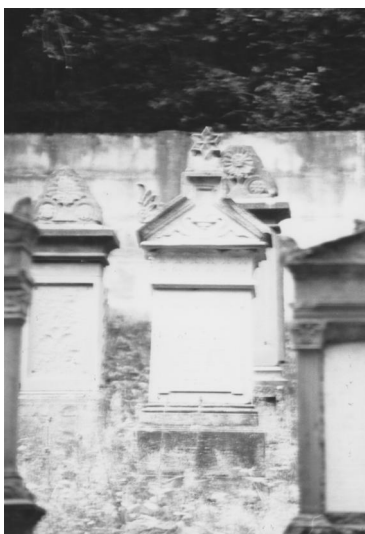
Jüdischer Friedhof Steinach.

Der jüdische Friedhof liegt nördlich von Steinach im Wald an der Straße nach Bad Neustadt/Saale. Er hat eine Größe von 1280 qm. Er wurde 1874 angelegt. Bis zur Einweihung des Friedhofs bestattete man die Toten in Kleinbardorf. Es sind vier Grabreihen mit etwa 100 Grabsteinen, darunter viele alte Steine erhalten; rechts des Eingang befinden sich Kindergräber. Vor dem Friedhofseingang befindet sich noch immer ein Wendeplatz für die Leichenwägen und –kutschen.