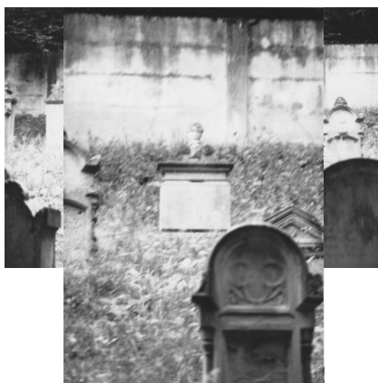
Jüdischer Friedhof Steinach.

Der jüdische Friedhof liegt nördlich von Steinach im Wald an der Straße nach Bad Neustadt/Saale. Er hat eine Größe von 1280 qm. Er wurde 1874 angelegt. Bis zur Einweihung des Friedhofs bestattete man die Toten in Kleinbardorf. Es sind vier Grabreihen mit etwa 100 Grabsteinen, darunter viele alte Steine erhalten; rechts des Eingang befinden sich Kindergräber. Vor dem Friedhofseingang befindet sich noch immer ein Wendeplatz für die Leichenwägen und –kutschen.