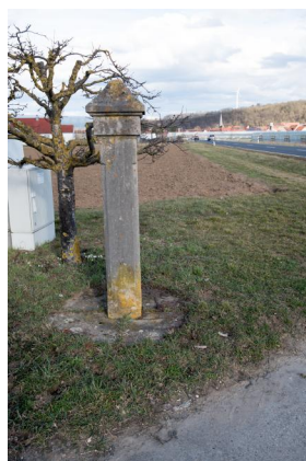
Segnitz, sog. Sabbatschranke, eine von ursprünglich drei gleichartigen Flurdenkmalen an den ehemaligen Ortsausgängen nach Frickenhausen, Zeubelried und Sulzfeld, Kalksteinsäule, Original von 1748 oder älter an der Straße nach Sulzfeld, Kopie nach verlorenem Original; am Weg nach Zeubelried (Aufnahme 2013).