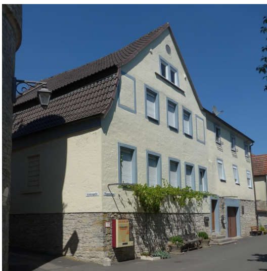
Segnitz, Mainstraße 26, ehem. "Brüssel'sche Handelsschule" (Aufnahme 2020).