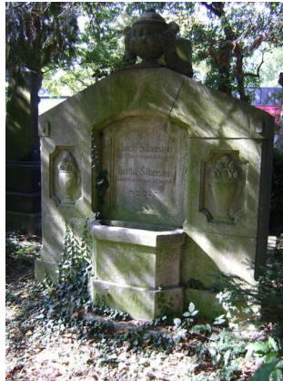
Jüdischer Friedhof Schweinfurt.