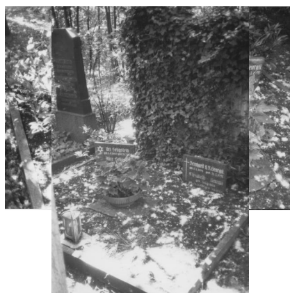
Jüdischer Friedhof Schweinfurt.