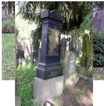
Jüdischer Friedhof Schweinfurt.