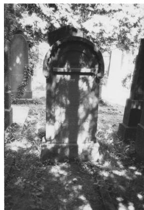
Jüdischer Friedhof Schweinfurt.