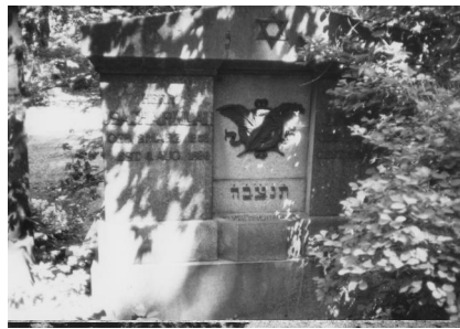
Jüdischer Friedhof Schweinfurt.