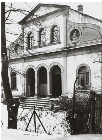
Schweinfurt, Taharahaushaus auf dem jüdischen Friedhof (Aufnahme um 1935).

Der jüdische Friedhof in Schweinfurt ist Teil des Städtischen Friedhofs (Abteilung 10) und von diesem durch eine Hecke abgegrenzt. Er hat eine Größe von über 1500 qm und wurde 1874 angelegt.