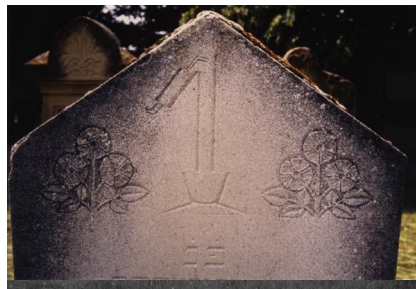
Jüdischer Friedhof Schwanfeld. Copyright Israel Schwierz, Würzburg