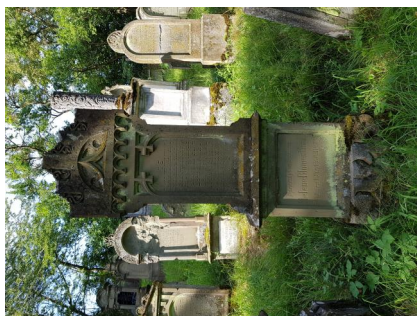
Jüdischer Friedhof Schwanfeld, 2020.