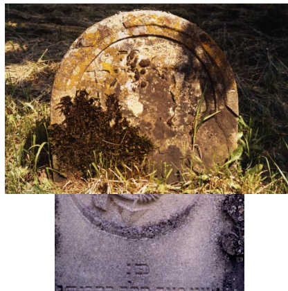
Jüdischer Friedhof Schwanfeld.