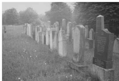
Jüdischer Friedhof Schwanfeld.