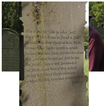
Jüdischer Friedhof Schwanfeld.