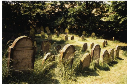
Jüdischer Friedhof Schwanfeld.