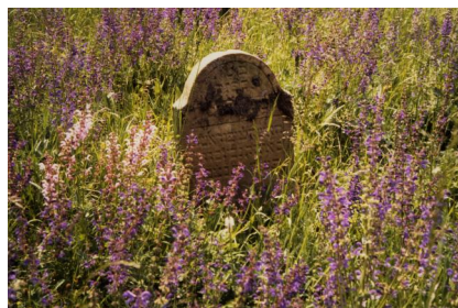
Jüdischer Friedhof Schwanfeld.