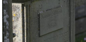
Jüdischer Friedhof Schwanfeld.