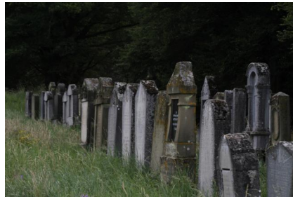
Jüdischer Friedhof Schwanfeld.