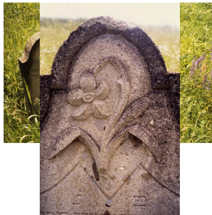
Jüdischer Friedhof Schwanfeld.