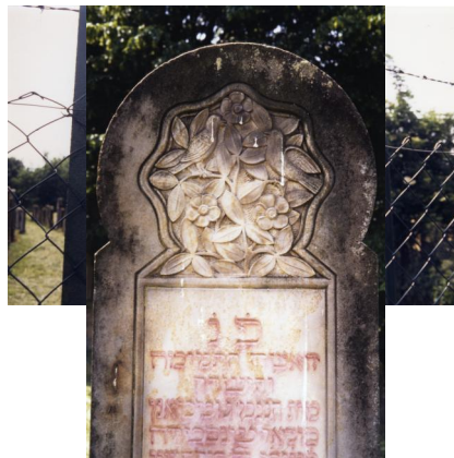
Jüdischer Friedhof Schwanfeld.