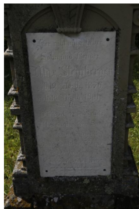
Jüdischer Friedhof Schwanfeld.