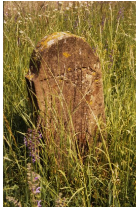
Jüdischer Friedhof Schwanfeld.