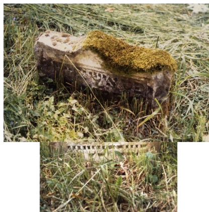
Jüdischer Friedhof Schwanfeld.