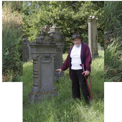
Jüdischer Friedhof Schwanfeld.

Israel Schwierz hat uns großzügigerweise die Originalfotos zu seiner 1988 erschienenen Dokumentation „Steinerne Zeugnisse jüdischen Lebens in Bayern“ überlassen. Dafür gilt ihm unser großer Dank. Diese Fotografien stellen gerade im Hinblick auf die in vielen Fällen in den letzten 25 Jahren sehr rasch fortgeschrittene Verwitterung der Grabsteine eine wertvolle Quelle dar.