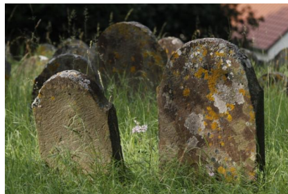
Jüdischer Friedhof Schwanfeld.