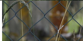
Jüdischer Friedhof Schwanfeld.