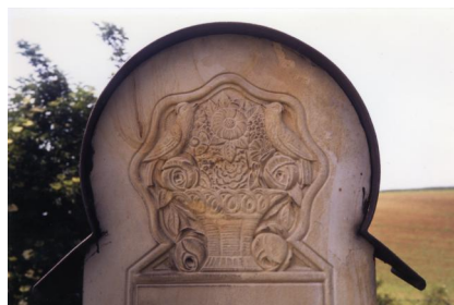
Jüdischer Friedhof Schwanfeld.