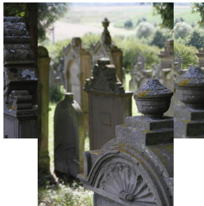
Jüdischer Friedhof Schwanfeld.