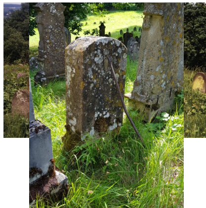
Jüdischer Friedhof Schwanfeld.