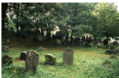
Jüdischer Friedhof Schopfloch.