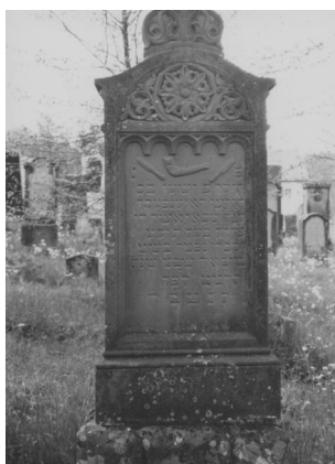
Jüdischer Friedhof Schopfloch.