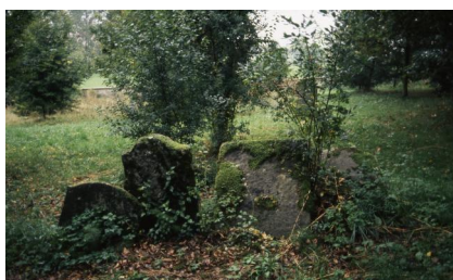
Jüdischer Friedhof Schopfloch.