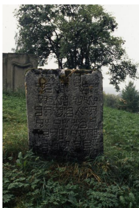
Jüdischer Friedhof Schopfloch.