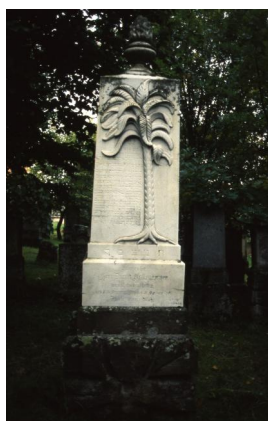
Jüdischer Friedhof Schopfloch.