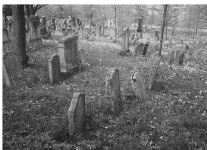
Jüdischer Friedhof Schopfloch.