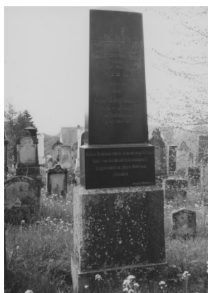
Jüdischer Friedhof Schopfloch.