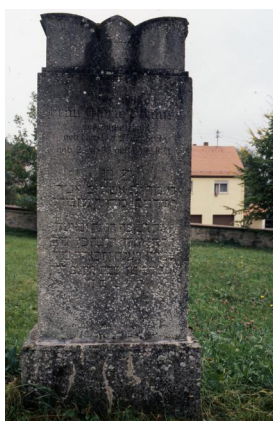
Jüdischer Friedhof Schopfloch.