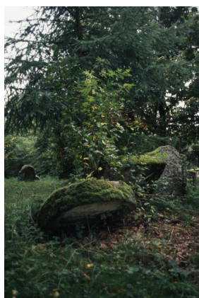
Jüdischer Friedhof Schopfloch.