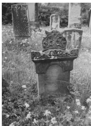
Jüdischer Friedhof Schopfloch.