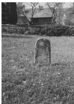
Jüdischer Friedhof Schopfloch.