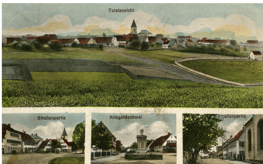
Schopfloch, kolorierte Postkarte mit insgesamt 4 Ansichten: - „Gesamtansicht“ mit jüdischem Friedhof am rechten Bildrand - „Straßenpartie“ mit Kirche - „Kriegerdenkmal“ - „Straßenpartie“ mit Synagoge am rechten Bildrand, 1920er-Jahre.

Der jüdische Friedhof Schopfloch liegt am nördlicher Ortsrand in Richtung Deutenbach. Mit 12980 qm ist er einer der größten jüdischen Friedhöfe in Bayern. Er wurde zu Beginn des 17. Jahrhunderts angelegt. Es fand über tausend Beerdigungen statt. Die letzten Beisetzungen erfolgten 1936/37.