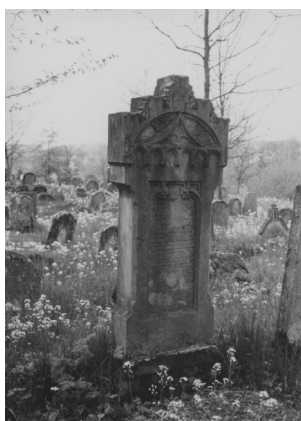
Jüdischer Friedhof Schopfloch.