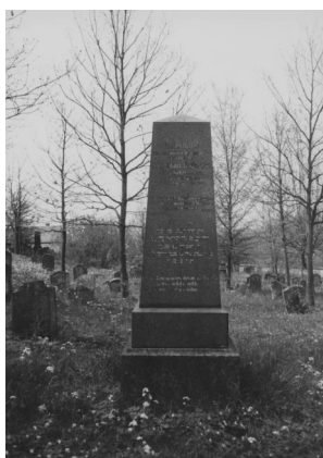
Jüdischer Friedhof Schopfloch.

- „Totalansicht“ mit Friedhof und Tahara-Haus am linken Bildrand - „Königstraße mit Kirche, Pfarrhaus und Schulhaus“ - „Neues Schulhaus“, 1924