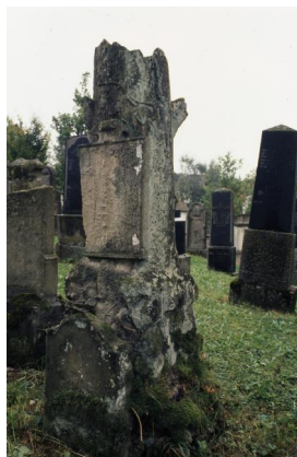
Jüdischer Friedhof Schopfloch.