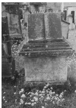
Jüdischer Friedhof Schopfloch.