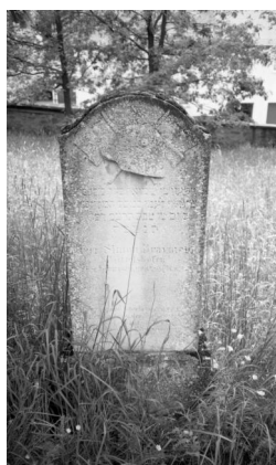
Schopfloch, jüdischer Friedhof, Grabstein mit Stahlhelm

Oppenheimer (Aufnahme Israel Schwier, 1996). Copyright BayHStA, BS N 80 80/41-03