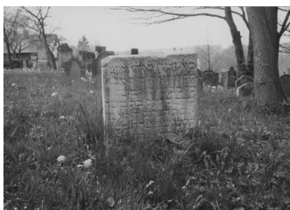
Jüdischer Friedhof Schopfloch.