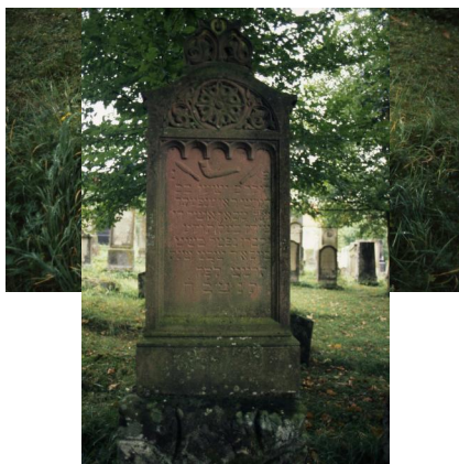
Jüdischer Friedhof Schopfloch.

In der epigrafischen Datenbank epidat des Steinheim-Instituts sind 1237 Inschriften von 1559 bis 1939 hier online zugänglich.