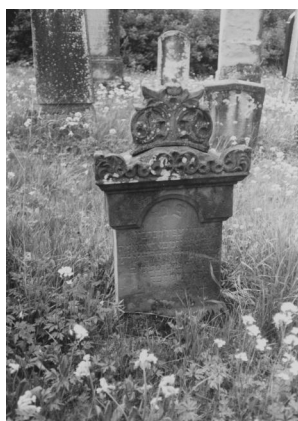
Jüdischer Friedhof Schopfloch.