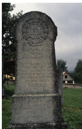
Jüdischer Friedhof Schopfloch.