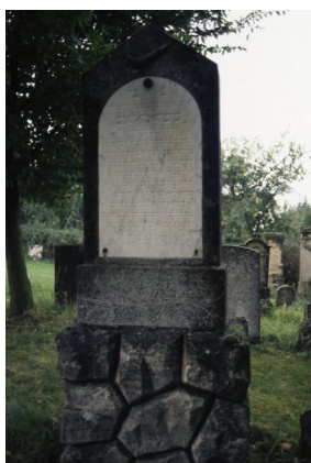
Jüdischer Friedhof Schopfloch.