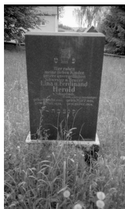
Schopfloch, jüdischer Friedhof, Grabstein von Lina und

von Simon Bravmann.