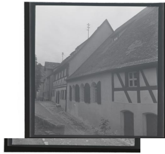
Aussenansicht der ehemaligen Synagoge in Schnaittach, 1939. Copyright Bayerisches Landesamt für Denkmalpflege München / Joseph Maria Ritz