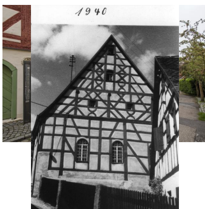
Ehemalige Synagoge Schnaittach.