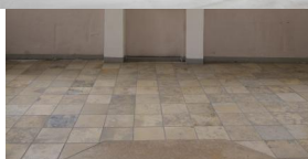
Innenansicht der ehemaligen Synagoge in Schnaittach.