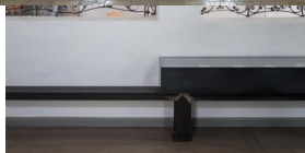
Innenansicht der ehemaligen Synagoge in Schnaittach.