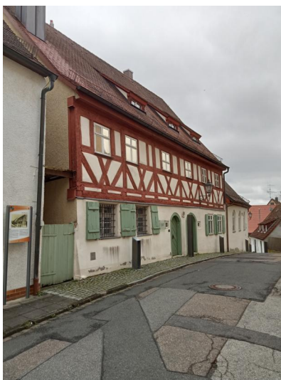
Schnaittach, Museumsgasse 12 - 16 (Außenstelle Jüdisches Museum Franken): Synagoge (rechts), Vorsängerhaus (mitte) u. Rabbinerhaus (links), Aufnahme 2023.

Dank einer ausführlichen Bauforschung im Jahr 1991 ist viel über das erste jüdische Gotteshaus in der Judengasse (heute Museumsgasse 18) bekannt. Es war wesentlich kleiner als sein Nachfolgerbau und hatte mit ihm nur die West- und Nordwand gemein: Der massive Ursprungsbau war auf einem unregelmäßig viereckigen Grundriss auf circa 10 x 10 Metern errichtet und besaß – vielleicht aus Gründen der Wehrhaftigkeit – eine Mauerstärke von gut einem Meter. Der Toraschrein war an der Ostwand in einem hervorspringenden Ständerker untergebracht. In der Tradition mittelalterlicher Synagogen, die nicht nur Bet- sondern auch Lehrhaus waren, befanden sich an der Nordwand Nischen mit Regalbrettern, die Bücher und Schriften verwahrten. Eine massive Wand trennte den südlichen Gebäudeteil ab und diente wahrscheinlich als Frauenabteilung. Nach der hebräischen Widmung hatten 1734/35 der Beerdigungs- und Wohltätigkeitsverein 14 kleine und einen großen Hängeleuchter gespendet.