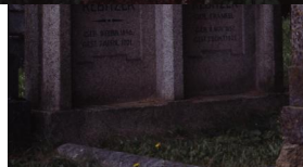
Jüdischer Friedhof Schnaittach.