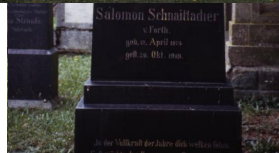
Jüdischer Friedhof Schnaittach.