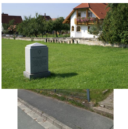
Schnaittach, jüdischer Friedhof I - Alter Teil, Grab von Berle Schnaittach[er] (Aufnahme 2022).