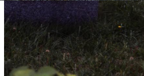
Jüdischer Friedhof Schnaittach.