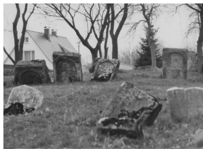
Jüdischer Friedhof Schnaittach.