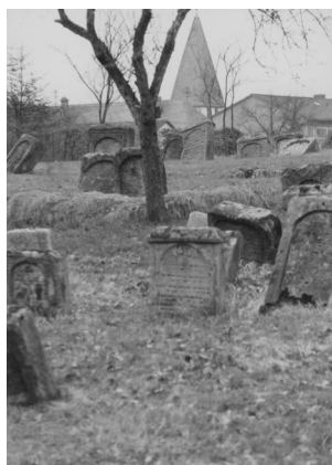
Jüdischer Friedhof Schnaittach.