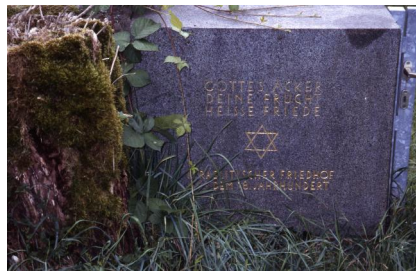
Jüdischer Friedhof Schnaittach.