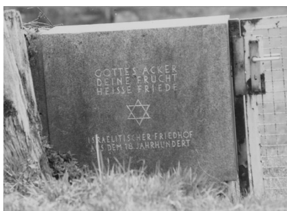
Jüdischer Friedhof Schnaittach.