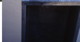
Jüdischer Friedhof Schnaittach.