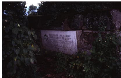
Jüdischer Friedhof Schnaittach.