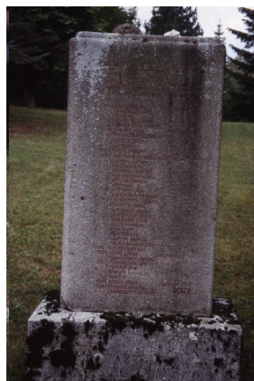
Jüdischer Friedhof Schnaittach.