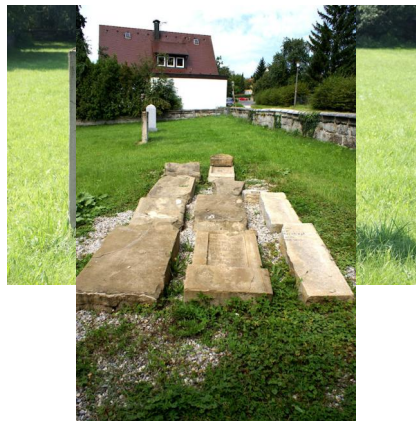
Jüdischer Friedhof Schnaittach, 1983.