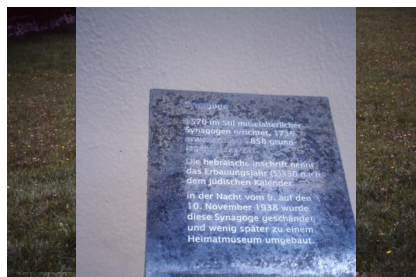
Jüdischer Friedhof Schnaittach.