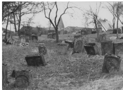
Jüdischer Friedhof Schnaittach.