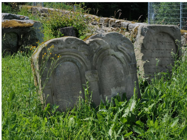
Schnaittach, jüdischer Friedhof I - alter Teil, Doppelgrab des Rabbiners Selig Chasan ben Chajim (Todesdatum zerstört) und seiner Frau Esther bat Alexander, gest. 1689 (Aufnahme 2022). Nach einer Sanierung wurde das Wurzelwerk entfernt und der Stein wieder aufgerichtet.

Der jüdische Friedhof Schnaittach liegt am nordöstlichen Ortsrand am Krankenhausweg. Es sind drei unterschiedliche Friedhofsanlagen mit verschiedenen Größen erhalten: Friedhof I: 4800 qm; Friedhof II: 2040 qm; Friedhof III: 1920 qm. Friedhof I wurde zu Beginn des 16. Jahrhunderts angelegt, Friedhof II 1834 und Friedhof III 1897. Es sind noch etwa 180 Grabsteine erhalten.