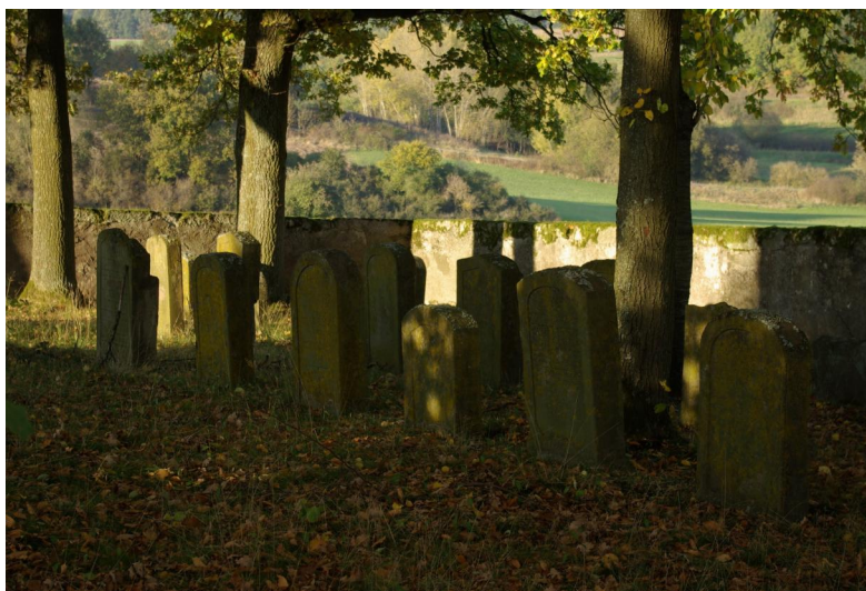
Der jüdische Friedhof Reichmannsdorf, 2011.

Der Friedhof liegt auf einer kleinen Anhöhe 300 m nördlich von Reichmannsdorf an der Straße nach Mönchsambach. Er hat eine Größe von über 800 qm und wurde 1840 angelegt. Es sind noch 31 Grabsteine erhalten. Die letzte Beisetzung erfolgte 1908.