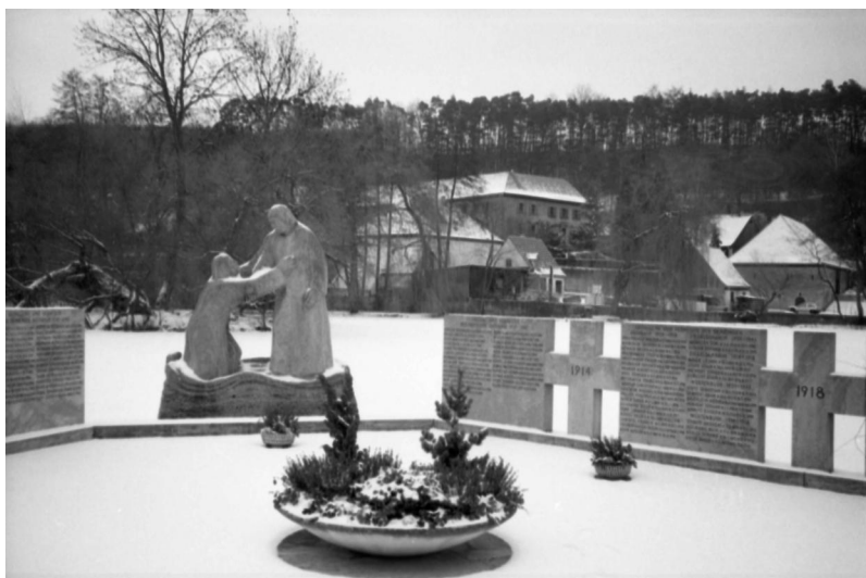
Aschbach, Kriegerdenkmal der beiden Weltkriege (Aufnahme Israel Schwier, 1996). Copyright BayHStA, BS N 80 80/22-04A

Das aus mehreren Gedenksteinen bestehende Kriegerdenkmal für die Gefallenen beider Weltkriege aus dem heutigen Stadtteil von Schlüsselfeld – dem Markt Aschbach – befindet sich zwischen den beiden Kirchen schräg gegenüber dem Rathaus.