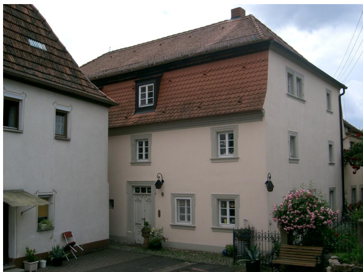
Das Gebäude der ehemaligen Synagoge von Südwesten (Aufnahme 2003).

Das um 1720 erbaute Gotteshaus war den Juden von den Freiherrn von Pölnitz zur Nutzung überlassen worden. Es stand bereits auf dem Grundstück des heute noch existierenden Gebäudes der Synagoge im Haus Nr. 23 (heute Bachgasse 8). 1763 erwarb die jüdische Gemeinde das Anwesen und errichtete eine neue Synagoge. Eine eingemeißelte Inschrift am Misrachfenster an der Ostseite des Betsaals nennt das Jahr 1766, in dem der zweigeschossige Massivbau über rechteckigem Grundriss vermutlich vollendet war. In Ostteil befand sich der Betsaal, im Westteil die Schule (bis Anfang der 1830er Jahre in Betrieb) und die Lehrerwohnung. 1830 wurde die Westempore zu einer dreiseitigen Anlage ausgebaut und die Ausstattung erneuert.