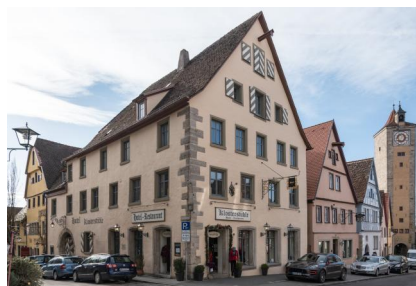
Rothenburg ob der Tauber, im Anwesen Herrngasse 21 befand sich bis 1938 im Erdgeschoß der Betsaal und im ersten Stock Schulzimmer und Lehrerwohnung (Aufnahme 2016).