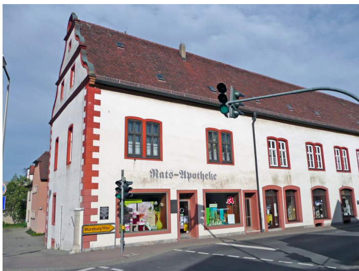
Ehem. Familiensitz der Familie Lehmann, Niederhofstraße 7 (Aufnahme 2013).