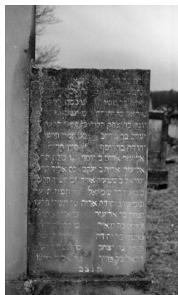
Kleinsteinach, Jüdisches Kriegerdenkmal, Detail der linken Namenstafel (Israel Schwierz, 1996).