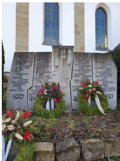
Kleinsteinach, Kriegerdenkmal vor der Filialkirche St. Bartholomäus (Aufnahme 2023).

Ein frühes Kriegerdenkmal aus den 1920ern, auf dem auch die Namen der jüdischen Gefallenen aus Kleinsteinach verzeichnet waren, hat sich nicht erhalten. Ein neues, geschmackvolles Kriegerdenkmal für die Gefallenen und Vermissten beider Weltkriege befindet sich in der Ortsmitte, direkt vor der Kirche St. Bartholomäus. Ein weiteres für die Toten der jüdischen Gemeinde steht auf dem außerhalb gelegenen Israelitischen Friedhof.