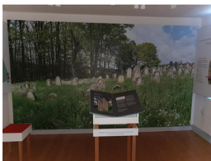
Kleinsteinach, Museum Jüdische Lebenswege, Vitrine mit Genisafund.