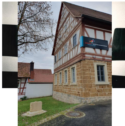
Ehemalige Jüdische Schule Kleinsteinach (Aufnahme 2019). Heute evangelisches Gemeindehaus mit Infotafel "Jüdische Lebenswege".