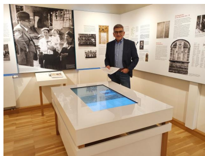
Kleinsteinach, Museum Jüdische Lebenswege im historischen Fachwerkbau, links die Skulptur eines Koffers als Mahnmahl der Initiative DenkOrte Würzburg.