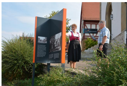
Kleinsteinach, Infotafel nahe des Museums: Der Arbeitskreis Landjudentum Kleinsteinach hat im Ort einen historischen Rundgang mit den gut sichtbaren Tafeln aufgebaut.