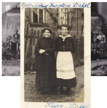
Kleinsteinach, Klassenfoto der Elementarschule im Jahr 1918 - jüdische und christliche Kinder wurden gemeinsam unterrichtet.