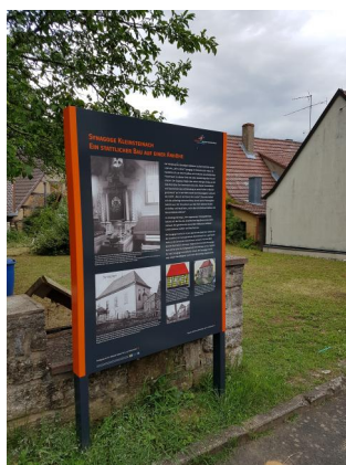
Der Ausschnitt aus einer Ansichtskarte aus den 1920er-Jahren zeigt die Synagoge Kleinsteinach. Theodor Harburger beschreibt in seinen zeitgleichen Notizen das Gebäude mit seiner Länge von 14,40 und Breite von 7,50 m als "stattlich". Auf dem Bild ist die Ostfassade mit dem Erker für den Toraschrein und darüber das runde Misrachfenster deutlich zu sehen.