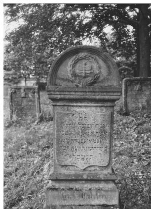
Jüdischer Friedhof Reckendorf.