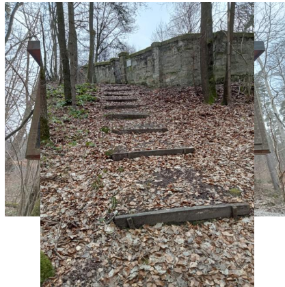
Der jüdische Friedhof Reckendorf am Lußberg (Aufnahme 2022).