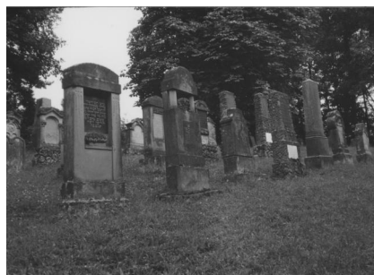
Reckendorf, jüdischer Friedhof, Grabmal der Familie Hellmann (Aufnahme um 1895).