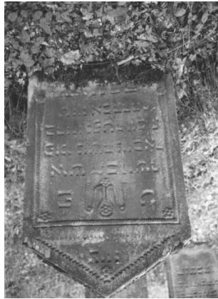
Jüdischer Friedhof Reckendorf. Copyright Israel Schwier, Würzburg)