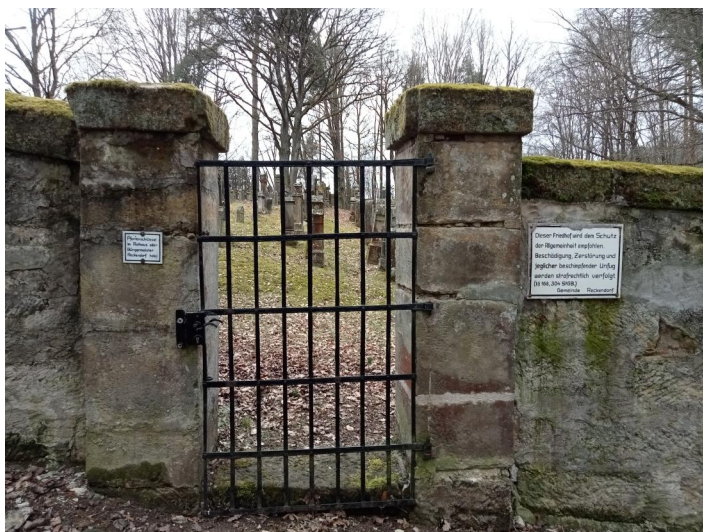
Der jüdische Friedhof Reckendorf am Lußberg (Aufnahme 2022).

Der jüdische Friedhof Reckendorf liegt am Lußberg etwa einen Kilometer südwestlich des Ortes. Er hat eine Größe von über 2500 qm und wurde 1798 angelegt. Es sind fast 400 Grabsteine erhalten.