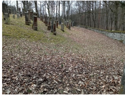
Der jüdische Friedhof Reckendorf am Lußberg (Aufnahme 2022).