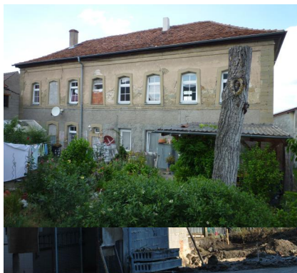
Ehemalige Synagoge, zweigeschossiger Walmdachbau, mit sich verjüngenden Tür- und Fensteröffnungen, Mitte 19. Jh. (Aufnahme 2016).