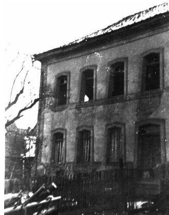
Das 1949/50 aufgenommene Bild zeigt noch deutlich die Zerstörungen am Synagogengebäude.