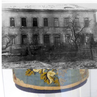
Torakrone ( 19.Jhdt. ) aus Stoff, aus dem Besitz der jüdischen Gemeinde in Altenschönbach.