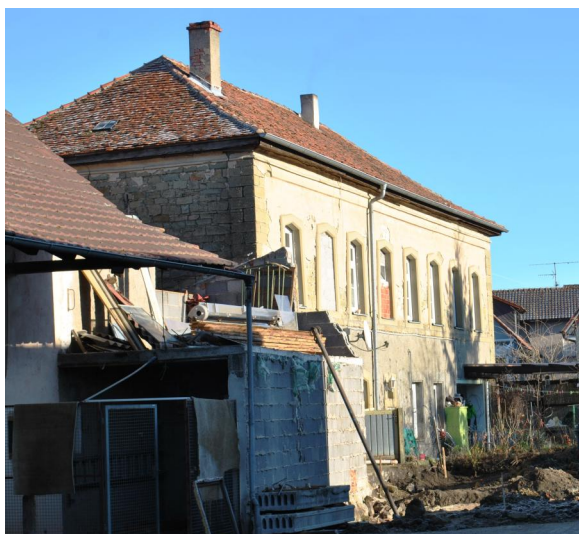
Ehemalige Synagoge, zweigeschossiger Walmdachbau, mit sich verjüngenden Tür- und Fensteröffnungen, Mitte 19. Jh. (Aufnahme 2016).