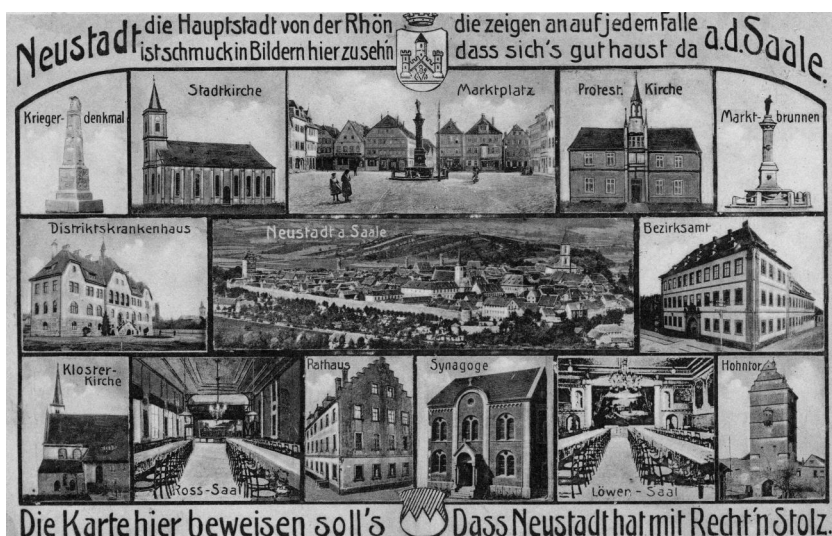
Postkarte von Neustadt/Saale mit Gesamtansicht und vierzehn Detailsichten, in der unteren Reihe Mitte rechts die Synagoge.

1699 wird erstmals ein jüdischer Lehrer in Neustadt erwähnt. Dies legt die Existenz eines Betraums oder einer Synagoge vor Ort nahe, da mit den Jugendlichen der Minjan von zehn religionsmündigen Männern wahrscheinlich gesichert war. Nachdem Valentin Voit von und zu Salzburg den Neustädter Juden gestattet hatte, im Jägerbau der Salzburg zu wohnen, richteten diese dort 1721/1722 eine Synagoge ein. Rund 20 Jahre später lebten zwei Schutzjuden mit ihren Familien auf der Salzburg. Ende des 18. Jahrhunderts verließen die jüdischen Familien die Burg und zogen in das benachbarte Dorf Neuhaus .