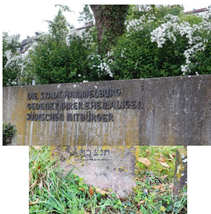
Jüdischer Friedhof Pfaffenhausen, 2020.