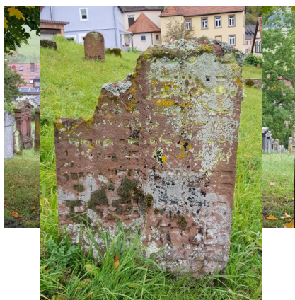
Jüdischer Friedhof Pfaffenhausen, 2020.

Schändungen: Der jüdische Friedhof in Pfaffenhausen wurde 1938 nach der Reichspogromnacht schwer geschändet. Nachdem am Samstag, dem 12. November 1938, sämtliche Grabsteine von SA-Männern gelockert und die Inschriften zum Teil zerschlagen wurden, schickte der Dorflehrer in Absprache mit dem Bürgermeister von Pfaffenhausen am Montagmorgen alle Schulkinder auf den Friedhof, wo sie "mit lauten Hau-Ruck-Rufen" die gelockerten Grabsteine umwerfen sollten. Die Grabsteine wurden dann in einer Ecke des Friedhofs gestapelt. Einige verwendete man zum Hausbau und zur Befestigung des Ufers der Saale in Pfaffenhausen. Das schmiedeeiserne Friedhofstor kam in eine Alteisensammlung. Den Friedhof selbst nutzte der NS-Bürgermeister bis April 1945 als Weidekoppel. Im Taharahaus richtete man 1943 einen NSV-Kindergarten ein. Vor dem Eintreffen der US-Truppen in Hammelburg (7. April 1945) stellten NS-Mitglieder die Grabsteine wieder auf dem Friedhof auf, allerdings nicht über den ursprünglichen Gräbern. Bis heute sind die Zeichen der Schändung zu erkennen: mutwillig zerschlagene Inschriften und Grabsteinsockel ohne zugehörige Grabsteine. Die Aktenlage zu diesen Vorgängen ist überliefert im Staatsarchiv Würzburg. (Freundlicher Hinweis von Petra Kaup-Klement, Haar)