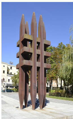
Passau, Innpromenade, Mahnmal für die Opfer des Nationalsozialismus errichtet 1996 (Aufnahme 2011).