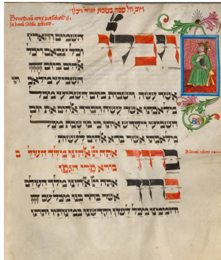
Passach-Haggada, letztes Viertel 15. Jahrhundert. Mit ihren 23 Miniaturen ist diese Handschrift ein gutes Beispiel für die jüdische Buchkunst des ausgehenden Mittelalters im südlichen Bayern. Die sehr wahrscheinlich für die jüdische Gemeinde in Passau gefertigte Haggadah erhielt ihre Illumination von einer christlichen Buchmalereiwerkstätte.