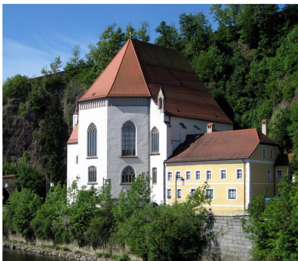
Passau, die "ehemalige Synagoge" St. Salvator, auf dem Hang die Veste Oberhaus (Aufnahme 2007).

Einen Hinweis auf eine mittelalterliche Synagoge bietet der 1314 erstmalig erwähnte Straßennamen "Judenschulstraße" (heute Zinngießerstraße). Da eine jüdische Gemeinde urkundlich seit dem Beginn des 13. Jahrhunderts nachgewiesen ist, dürfte hier auch die Bauzeit zu suchen sein. Ob es sich um ein Gotteshaus oder um einen Betraum in einem der jüdischen Häuser handelte, ist unbekannt. Nach der Neugründung einer Gemeinde in der sogenannten Ilzstadt auf der Donauseite, unterhalb der Veste Oberhaus, wurde dort zu Beginn des 15. Jahrhunderts eine neue Synagoge direkt am Flussufer erbaut.