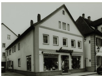
Von Abraham Reutlinger 1848/49 erbautes zweistöckiges Wohn- und Geschäftshaus (Deisingerstr. 16).