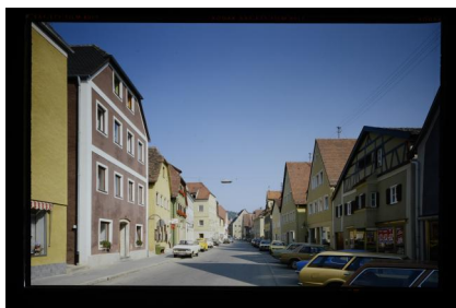
Ehemalige Judengasse, heute Deisinger Straße, in Pappenheim, 1979.