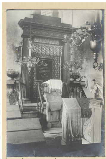
Innenansicht der Synagoge. Aufnahme von Theodor Harburger, rückseitig signiert und beschriftet: "Blick auf Aron ha-Kodesch". Copyright Bayerisches Landesamt für Denkmalpflege, München / Theodor Harburger

Das erste jüdisches Gotteshaus in Pappenheim wird in einem Ablassbrief von Papst Nikolaus V. erwähnt. Ausgestellt wurde dieser am 2. April 1452 für den vergrößerten, 1476 vollendeten Neubau der Marienkirche (heute evangelische Stadtpfarrkirche an der Graf-Carl-Straße). Auf dem Bauplatz stand eine Synagoge ("sinagoge Judeorum"), die im Zuge der Arbeiten abgerissen wurde. Über ihr Aussehen ist nichts überliefert. 1657 ist erneut von einer "Schul" die Rede, vermutlich identisch mit einem Betsaal im Wohnhaus des Juden Salomon (heute Deisinger Straße 19), die ab 1666 nachweisbar war. Sie verfügte über eine Mikwe im Keller. Ein Synagogenleuchter verursachte am 18. Juni 1712 einen Brand, der das ganze Haus zerstörte. An der Rettung von Ritualien beteiligten sich auch die christlichen Bewohner Pappenheims. Die Kultusgemeinde wehrte sich anschließend vergeblich gegen eine Geldstrafe von 400 Gulden, die ihnen die Obrigkeit wegen des fahrlässigen Feuers auferlegte.