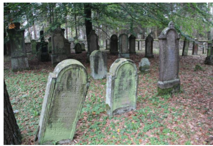
Jüdischer Friedhof Oberwaldbehrungen.