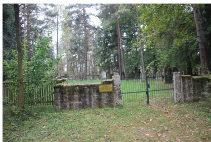
Jüdischer Friedhof Oberwaldbehrungen, 2014.