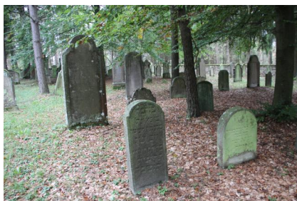
Jüdischer Friedhof Oberwaldbehrungen, 2014.