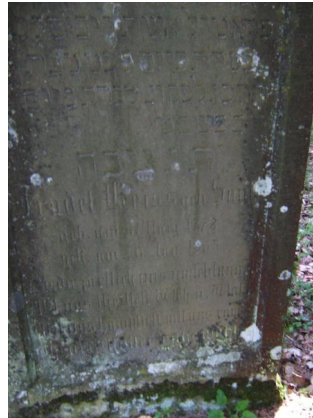
Jüdischer Friedhof Oberwaldbehrungen.