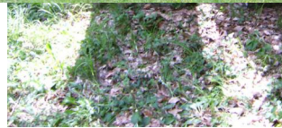
Jüdischer Friedhof Oberwaldbehrungen.