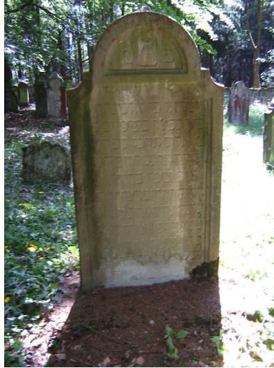
Jüdischer Friedhof Oberwaldbehungen.

Der jüdische Friedhof liegt auf einer Anhöhe nordöstlich von Oberwaldbehungen im Wald. Er hat eine Größe von fast 3000 qm und wurde 1842 eingerichtet. Etwa 132 Grabsteine sind erhalten.