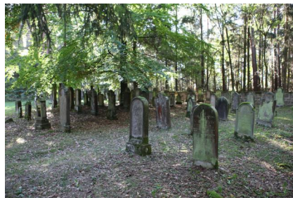
Jüdischer Friedhof Oberwaldbehrungen.