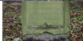
Jüdischer Friedhof Oberwaldbehrungen.