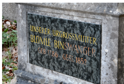
Osterberg, Mizzawot auf dem jüdischer Friedhof (Aufnahme 2021).