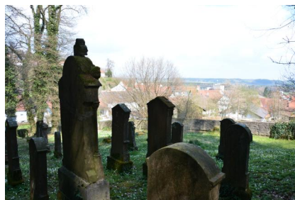
Osterberg, Mizzawot auf dem jüdischer Friedhof (Aufnahme 2021).