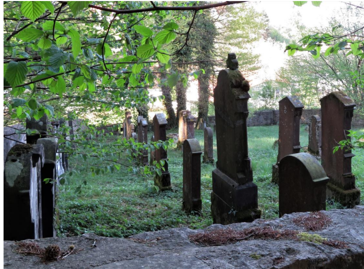
Jüdischer Friedhof Osterberg, 2020.

Der jüdische Friedhof liegt am Kolbenweg am Ortsende auf leicht ansteigendem Gelände. Er hat eine Größe von etwa 700 qm und wurde um 1840 angelegt. Es sind etwa 46 Grabsteine erhalten.