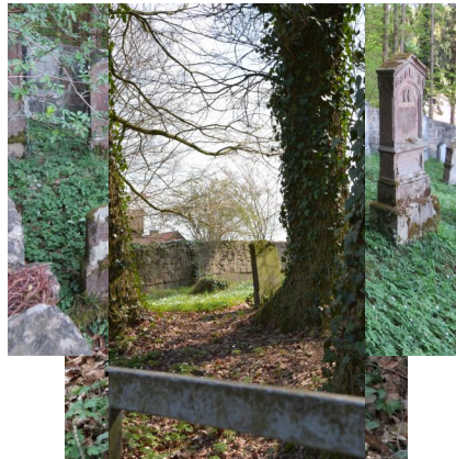
Jüdischer Friedhof Osterberg, 2020.