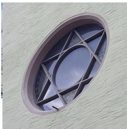
Oettingen, Schäfflergasse 1, ehem. jüdisches Gemeindezentrum mit Synagoge und Rabbinerwohnung. Heute teils Neubau, Misrachfenster erhalten, Wandmalerei mit Rabbiner (Aufnahme 2023).