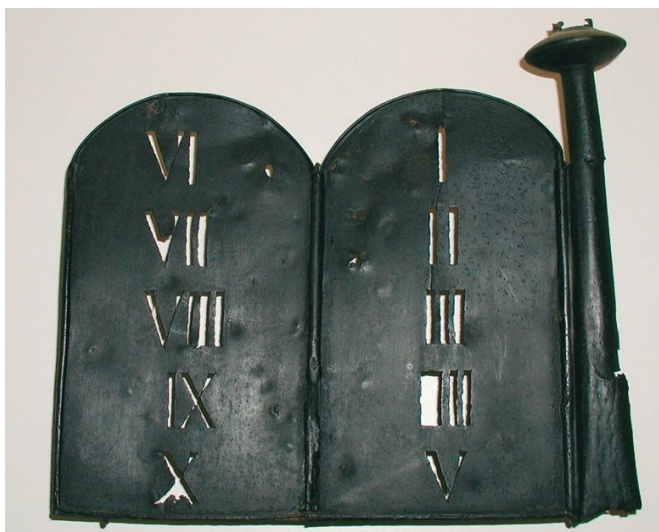
Oettingen, Wetterfahne der barocken Synagoge mit mosaïschen Gesetzestafeln (Aufnahme 2021).

Die jüdische Gemeinde der katholischen Linie der Grafen zu Oettingen versammelte sich in den Jahren 1655 und 1668 im Anwesen C 2 des Juden Manasse (heute Schloßstraße 48). Die Schutzjuden der evangelischen Linie beteten von 1670 bis 1684 auf der anderen Straßenseite im Anwesen C 49 (heute Schloßstraße 47). Um 1680 wurde ein Stadel hinter dem Rathaus, das man zuvor gemeinsam erworben hatte, zu einer Synagoge umgebaut. Daneben errichteten beide Gemeinden ein Haus für den Rabbiner und seine Familie. Über die Ausstattung ist nichts bekannt, vielleicht wurde aber eine Wetterfahne mit den mosaïschen Gesetzestafeln beim Neubau wiederverwendet.