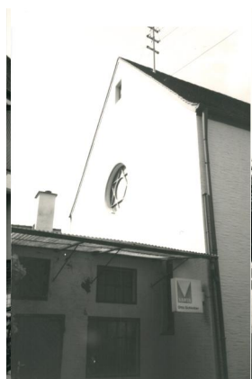
Außenansicht des ehemaligen Synagogengebäudes, Aufnahme 1987.