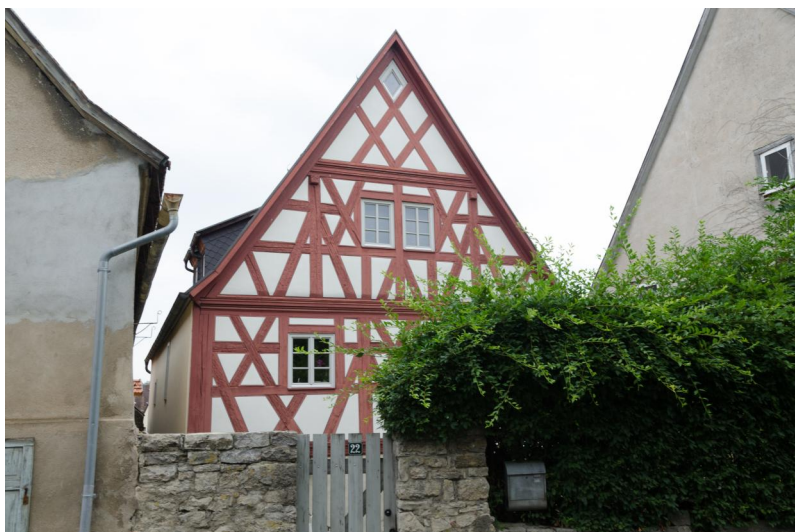
Ehemaliges jüdisches Wohnstallhaus von 1628.

In Goßmannsdorf gab es bis Anfang des 19. Jahrhunderts drei Herrschaften, die befugt waren, Schutzjuden aufzunehmen: die Freiherrn Zobel von Darstadt, die Freiherrn Geyer von Ingolstadt, die 1708 durch die Markgrafen von Brandenburg-Ansbach abgelöst wurden, sowie das Hochstift Würzburg. 1510 werden in den Protokollen des Würzburger Domkapitels erstmals Juden aus Goßmannsdorf genannt, die in Würzburg Handelsgeschäften nachgehen wollten. In einer Urkunde aus dem Jahr 1532 sind zehn jüdische Männer erwähnt bei denen es sich vermutlich um Haushaltsvorstände handelte. Weitere Dokumente im Staatsarchiv Wertheim aus den Jahren 1514 bis 1518, 1523 und 1543 verweisen auf einzelne Juden im Ort. Ob sich damals bereits eine Kultusgemeinde mit entsprechenden Einrichtungen bilden konnte, ist nicht bekannt.