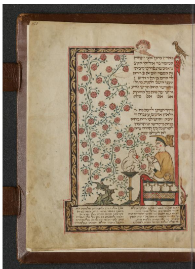
Schlußseite eines Pentateuchs mit Raschi-Kommentar, geschrieben und illuminiert durch Isaak ben Elijahu aus Ochsenfurt, beendet in Brüssel 1309 (Ms. Levy 19, f. 625r)

Nicht nur in umliegenden Dörfern, auch in der Stadt Ochsenfurt existierte im Hochmittelalter eine jüdische Kultusgemeinde. Die namentliche Nennung des Vorbeters Elija weist auf das Bestehen einer Synagoge im 13. Jahrhundert hin. Die frühesten Nachrichten über jüdisches Leben in Ochsenfurt stammen aus dem Jahr 1298, in dem die Familien am Ort Opfer des Rintfleisch-Pogroms wurden. Nachdem im Hochstift Würzburg 1336 die Armleder-Verfolgung in Franken gewütet hatte, war die jüdische Gemeinde erloschen. Erst 1377 sind wieder Juden in der Stadt aktenkundig, die sich überregional im Finanzgeschäft betätigten.