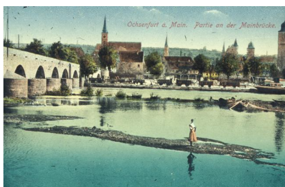
Ochsenfurt a.M., Nördliches Mainufer, Postkarte gedruckt bei Justus Philipp Vollert, um 1898 (Ausschnitt) Rechts der Centturm, im Bildhintergrund die Malzfabrik Samuel Rau.