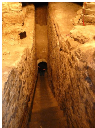
Obernbreit, An der Synagoge 1, ehem. Synagoge mit Keller-Mikwe, 2011 wieder aufgedeckt, ca. 9 m unter dem Straßenniveau (Aufnahme 2011).