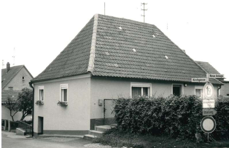
Das Gebäude der früheren jüdischen Schule, Kirchgasse 33 (Aufnahme 1987).

Juden sind in Obernbreit, das seit 1607 Sitz des Oberschultheißenamts der brandenburgisch-ansbachischen Maindörfer war, seit den 1530er Jahren belegt. Aus dieser Zeit stammen der Eintrag eines Judeideis im Dorfbuch und zwei Schutzbriefe. 1538 ist mit Loeb, der als Kläger und Schuldner vor dem Segnitzer Dorfgericht auftrat, erstmals ein Jude in Obernbreit namentlich fassbar. Aus dem Jahr 1567 ist ein Ausweisungsbescheid für einen in Obernbreit ansässigen Juden überliefert, den das Oberamt Creglingen ausgestellt hatte – ein Dokument der widersprüchlichen Judenpolitik der Markgrafschaft, die zwischen gezielter Ansiedlung von Juden zur Stärkung der Wirtschaftskraft und Rücksichtnahme auf antijüdische Ressentiments der örtlichen Bevölkerung schwankte.