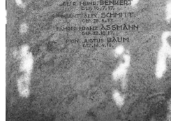
Nordheim vor der Rhön, Kriegerdenkmal, Detail mit den Namen von Gustav Rosenthal und Justus Baum.