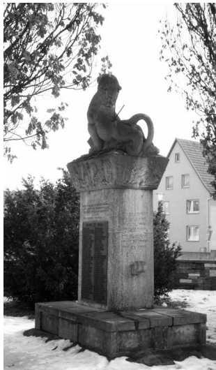
Nordheim vor der Rhön, Kriegerdenkmal für die Gefallenen beider Weltkriege (Aufnahme Israel Schwierz, 1996). Copyright BayHStA, BS N 80 80/75-16A

Das Kriegerdenkmal für die Gefallenen beider Weltkriege aus Nordheim vor der Rhön befindet sich in der Ortsmitte am Marktplatz zwischen dem Rathaus und dem Fließchen Streu.