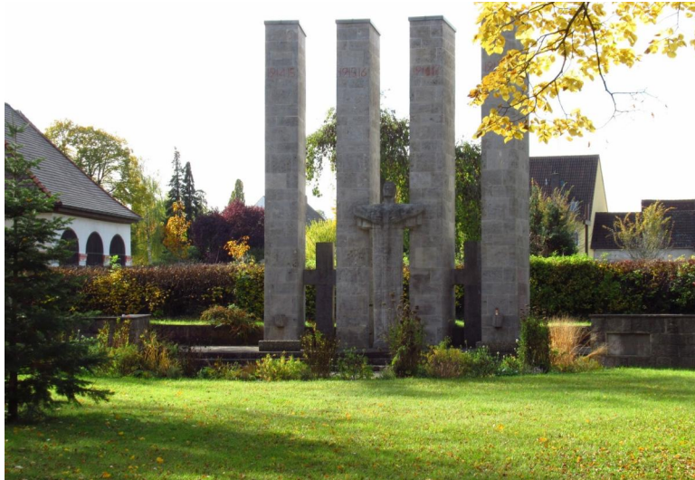
Denkmal für die Gefallenen des Ersten Weltkriegs

In Neustadt an der Aisch kann man ein großes Kriegerdenkmal für die Gefallenen des Ersten Weltkrieges vor dem städtischen Friedhof finden.