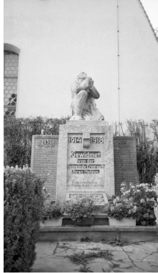
Ermreuth, kommunales Kriegerdenkmal 1914-18 und 1939-45 (Aufnahme 1996). Copyright BayHStA, BS N 80 80/80-25A

Das Kriegerdenkmal für die Gefallenen beider Weltkriege aus Ermreuth befindet sich unmittelbar vor der evang.-luth. Kirche St. Peter und Paul.