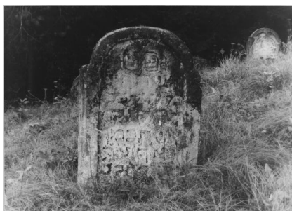
Ermreuth, jüdischer Friedhof (Aufnahme 1986).