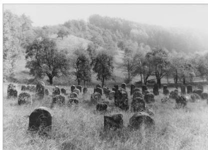
Ermreuth, jüdischer Friedhof (Aufnahme 1986).