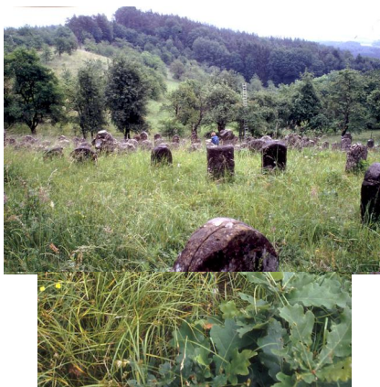
Jüdischer Friedhof Ermreuth, 1990.

Schändungen: Im März 1936 wurden 19 Grabsteine umgeworfen.