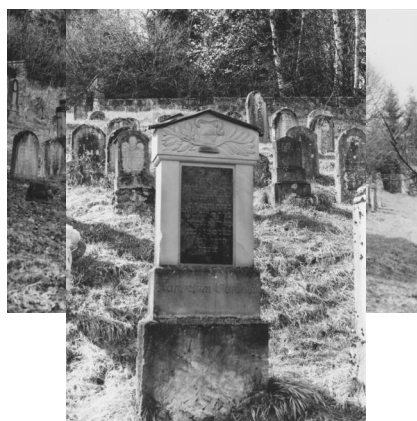
Jüdischer Friedhof Ermreuth.