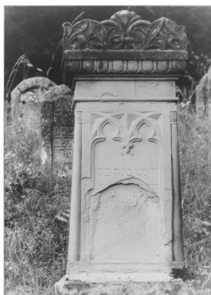
Ermreuth, jüdischer Friedhof (Aufnahme 1986).