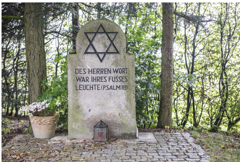
Gedenkstätte auf dem KZ-Friedhof Neumarkt St. Veit

In Neumarkt-St. Veit hatte bis 1338 eine Jüdische Gemeinde bestanden. Sie war als Folge der „Judenmorde zu Deggendorf und Straubing“ wahrscheinlich im gleichen Jahr vollkommen ausgerottet worden. Von einer mittelalterlichen Begräbnisstätte gibt es keine Spuren.