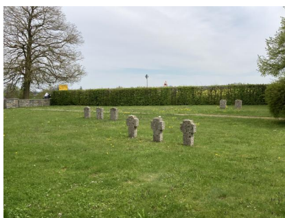
Gedenkstätte auf dem KZ-Friedhof Neumarkt St. Veit

Der KZ-Friedhof liegt an der Auffahrt zur B 299 in Richtung Mühldorf etwa 200 m hinter dem Ortsende. Eine Hecke umgibt das parkähnlich mit Laubbäumen und Ziersträuchern angelegte Areal. Auf dem linken Torpfosten befindet sich die Inschrift: "Letzte Ruhestätte von 392 Opfern des Nationalsozialismus + April 1945", auf dem rechten Torpfosten: "Geh nicht vorüber Wandersmann - dass Liebe tilgt / was Hass getan". Ein mit Steinplatten gepflasterter Weg fährt geradeaus zu einem Kreuz und, in der Mitte rechts abbiegend, zu einem jüdischen Denkmal inmitten von Ziersträuchern mit folgender Inschrift: "Des Herren Wort war ihres Fußes Leuchte (Psalm 119)". Auf den Grasflächen und der Umgrenzung stehen symbolische Grabsteine mit jüdischen und christlichen Zeichen.