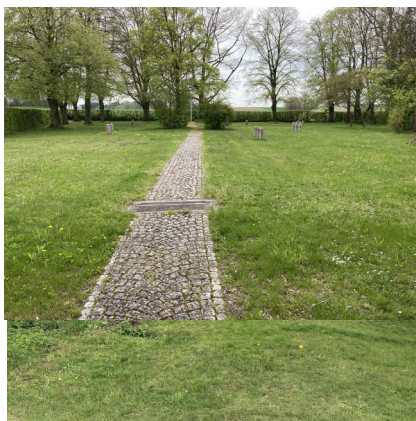
Neumarkt-St. Veit, KZ-Friedhof und Gedenkstätte (Aufnahme 2023).