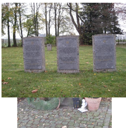
KZ-Friedhof und Gedenkstätte Neumarkt-St. Veit.