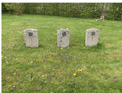
Neumarkt-St. Veit, KZ-Friedhof und Gedenkstätte (Aufnahme 2023).