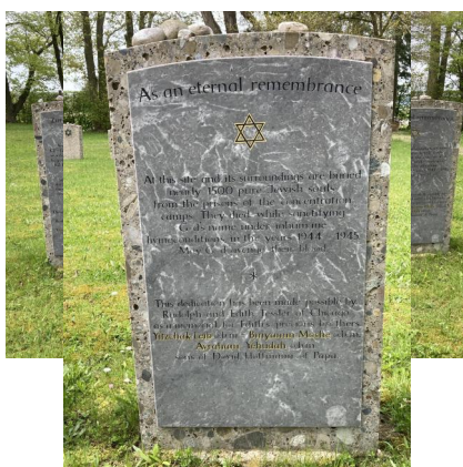
Neumarkt-St. Veit, KZ-Friedhof und Gedenkstätte (Aufnahme 2023).