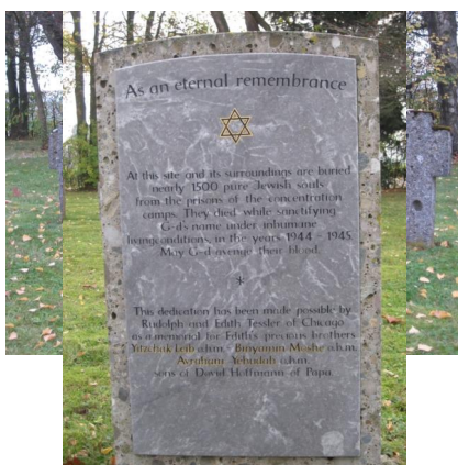
KZ-Friedhof und Gedenkstätte Neumarkt-St. Veit.