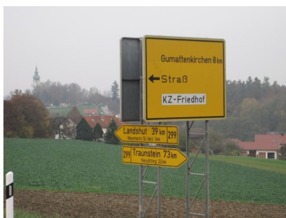
KZ-Friedhof und Gedenkstätte Neumarkt-St. Veit.