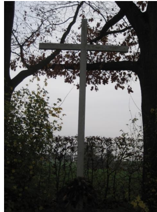
KZ-Friedhof und Gedenkstätte Neumarkt-St. Veit.