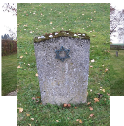
KZ-Friedhof und Gedenkstätte Neumarkt-St. Veit.