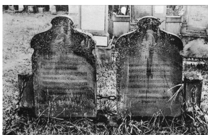
„Die Gräber der jüdischen Soldaten, gefallen am 10. Juli 1866, auf dem israelitischen Friedhof in Bad Kissingen“.