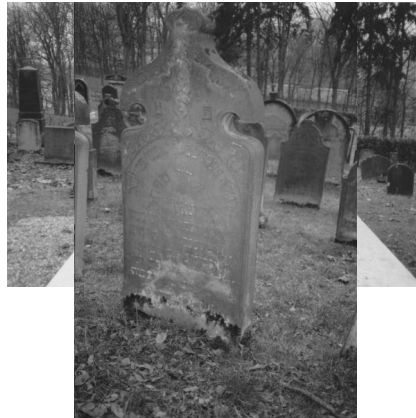
Jüdischer Friedhof Bad Kissingen.