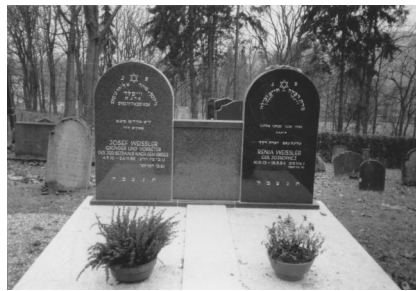
Jüdischer Friedhof Bad Kissingen.