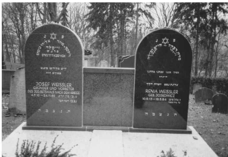
Jüdischer Friedhof Bad Kissingen.

Der jüdische Friedhof an der Bergmannstraße Im südöstlichen Teil der Stadt wird 1817 zum ersten Mal erwähnt. Er hat eine Größe von über 5000 qm. Mehr als 400 Grabsteine sind noch erhalten. Der älteste Grabstein stammt von 1819. Das letzte Begräbnis während der NS-Zeit erfolgte 1942. Dann wurden nach 1946 die Begräbnisse wieder aufgenommen. Der Friedhof dient wieder als Begräbnisstätte für die jüdischen Bürger der Stadt und für hier verstorbene Kurgäste.