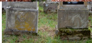
Der jüdische Friedhof in Bad Kissingen.