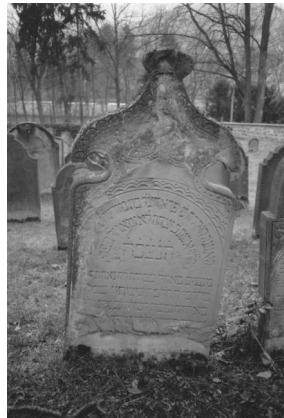
Jüdischer Friedhof Bad Kissingen.