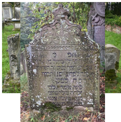
Grabstein der Familie Frank&nbsp;auf dem jüdischen Friedhof Bad Kissingen.