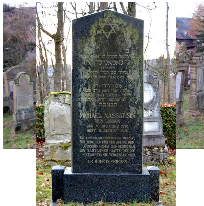
Der jüdische Friedhof in Bad Kissingen.