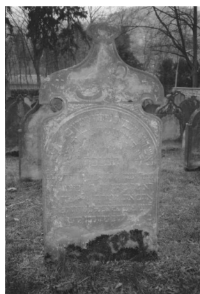
Jüdischer Friedhof Bad Kissingen.