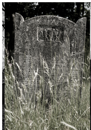
Jüdischer Friedhof Sulzbürg, 2007/08