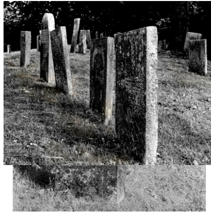
Jüdischer Friedhof Sulzbürg, 2007/08