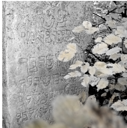
Jüdischer Friedhof Sulzbürg, 2007/08