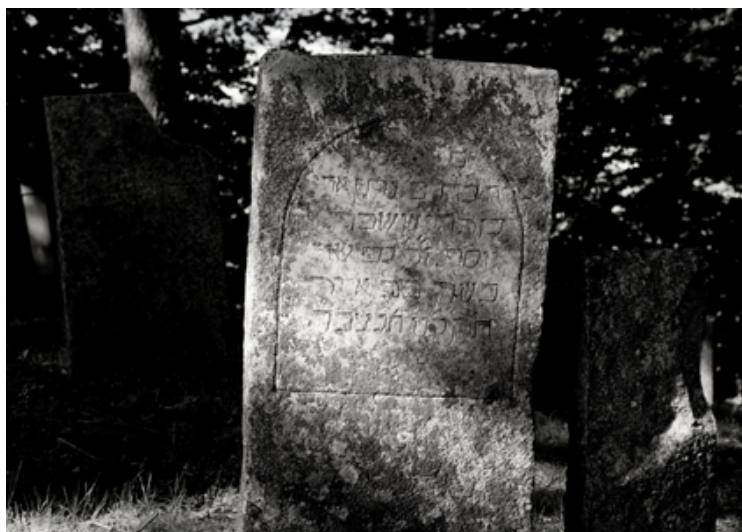
Jüdischer Friedhof Sulzbürg, 2007/08

Der jüdische Friedhof liegt Mühlhausen/Opf., mitten im Ortsteil Sulzbürg, an der Engelgasse. Er ist 3700 qm groß und wurde möglicherweise schon im Spätmittelalter belegt. Die erste dokumentierte Belegung war 1632. Die letzte Beerdigung fand im April 1938 statt.