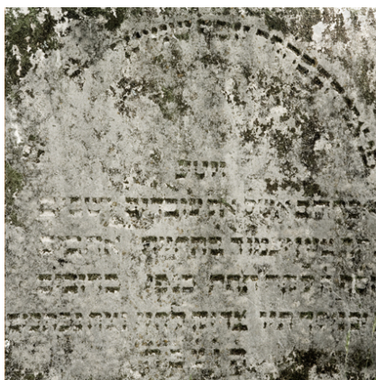
Jüdischer Friedhof Sulzbürg, 2007/08

Fotodokumentation: Die Fotografien entstammen einer Serie, die der Fotograf Edgar Pielmeier im Jahr 2007, vor Beginn der Sanierung des Sulzbürger Jüdischen Friedhofs aufgenommen hat. Die Bilder haben nicht die Absicht einer Dokumentation, vielmehr wollen sie die Stimmung zu verschiedenen Tages- und Jahreszeiten einfangen, die Eigenart des Ortes wiedergeben, der in mehr als einem Sinn Vergangenes bewahrt. Aus der Fotoserie wurde eine Ausstellung, die in dem 2009 im Eigenverlag erschienenen Buch „Hier ist verborgen. Impressionen vom Jüdischen Friedhof in Sulzbürg (mit Texten von Heide Inhetveen) dokumentiert ist (ISBN 978-3-00-029257-6).