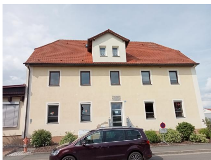
Mühlhausen, Reizenstein'sche "Kleinkinderbewahranstalt" bzw. "David und Jette Reizenstein Familienstiftung" in der Bamberger Straße 21 (Aufnahme 2022).