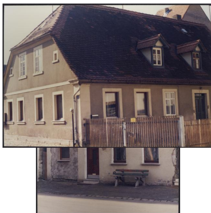
Mühlhausen, Bamberger Str. 21, ehem. Reitzenstein'sche Kinderstiftung mit Gedenktafel (Aufnahme um 1985).