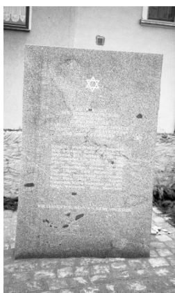
Mühlhausen, Denkmal für die Opfer der Shoah (Aufnahme Israel Schwierz, 1997). Copyright BayHStA, BS N 80 80/54-03A