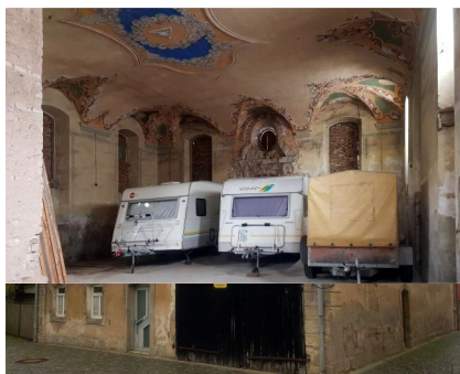
Mühlhausen, Westseite der Synagoge Mühlhausen. Das Scheunentor wurde 1940 eingebaut (Aufnahme 2019).