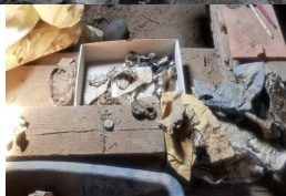
Mühlhausen, erste Untersuchung des Genisa-Fundes auf dem Dachboden der ehemaligen Synagoge Mühlhausen (Aufnahme 2020).