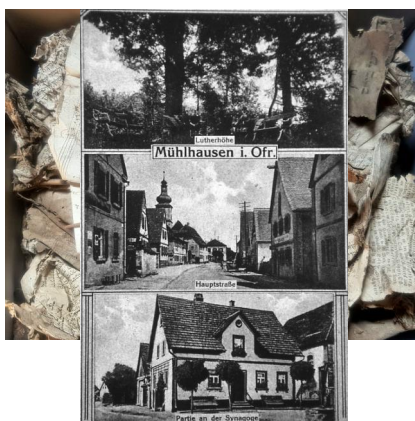
Mühlhausen, Fundort der Genisa auf dem Dachboden der ehemaligen Synagoge (Aufnahme 2020).