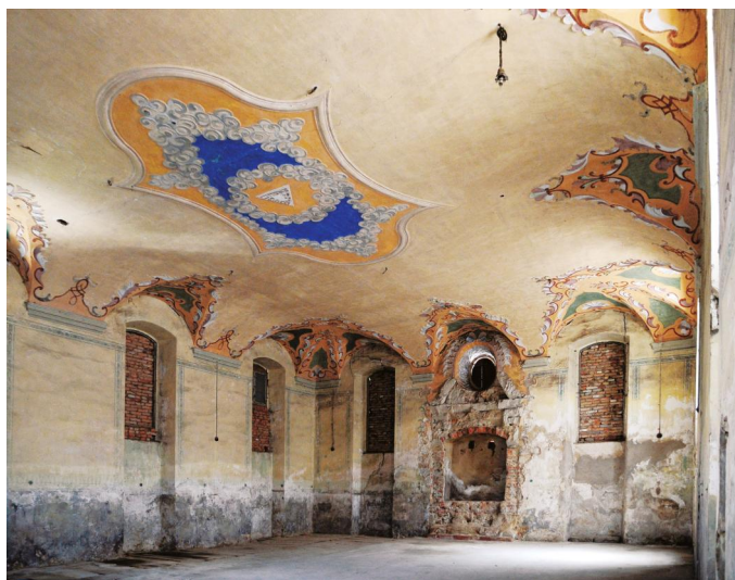
Der Innenraum der ehemaligen Synagoge Mühlhausen, 2017.

Eine erste Synagoge muss bereits in der zweiten Hälfte des 17. Jahrhunderts im Ort gestanden haben. Über Standort und Aussehen ist nichts bekannt. Im Jahr 1686 war diese erste Synagoge baufällig und „nicht mehr anständig“. Die Gemeinde pachtete ein Grundstück im Schlossgarten (heute Schlossweg 5) und errichtete einen Neubau. Da aber auch dieses neue Gotteshaus bis zur Mitte des 18. Jahrhunderts nicht mehr ausreichte, erwarb die Kultusgemeinde das Anwesen und schloß am 17. September 1755 einen detaillierten "Bau-Contract" mit Maurermeister Johann Scheuber aus Höchststädt, der nach dem Vorbild von Baiersdorf eine größere Synagoge errichten sollte. Scheuber stellte das zweigeschossige Bauwerk wohl bis Anfang 1757 weitgehend fertig, ab Juni konnte es benutzt werden.