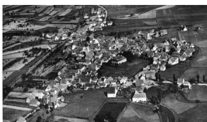
Auf der Postkarte ist im unteren Feld die Synagoge als Gebäude auf der rechten Seite abgebildet.