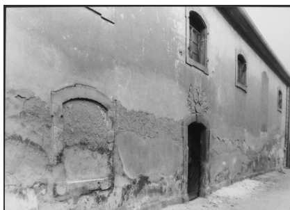
Mühlhausen, Wappen der Freiherren von Egloffstein über dem Eingang der ehemaligen Synagoge (Aufnahme 2017).