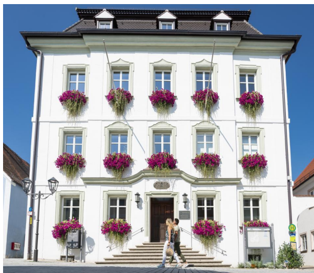
Monheim, Marktplatz 23, Rathaus - ehem. Palais Model mit biblischen Stuckaturen (Aufnahme 2019).

Das schwäbische Monheim ist in seinen Ursprüngen ein Klosterdorf und entstand um 870 mit dem gleichnamigen Benediktinerinnenkloster "Mowanheim". 1340 folgte die Erhebung zur Stadt durch die Grafen von Pappenheim. Im Spätmittelalter gibt es spärliche Hinweise auf jüdisches Leben im Ort: 1434 und 1441/42 sind jeweils vier Familien nachgewiesen. Danach schweigen die Quellen wieder, eine kontinuierliche Ansiedlung von Schutzjuden ist erst wieder ab 1623 nachgewiesen. Sie hatten sowohl landesherrliches Schutzgeld als auch Gebühren an die Stadt Monheim zu entrichten.