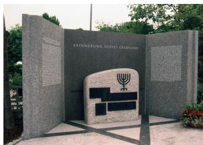
Gedenkstätte für die Synagoge, die jüdische Gemeinde

Ersten Weltkrieg militärische Auszeichnungen.