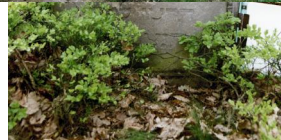
Jüdischer Friedhof Memmelsdorf.