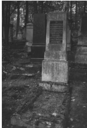
Jüdischer Friedhof Memmelsdorf.