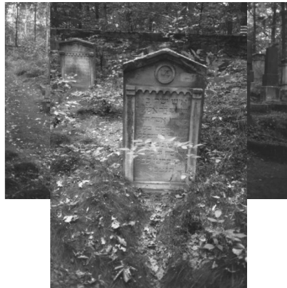
Jüdischer Friedhof Memmelsdorf.