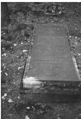
Jüdischer Friedhof Memmelsdorf.