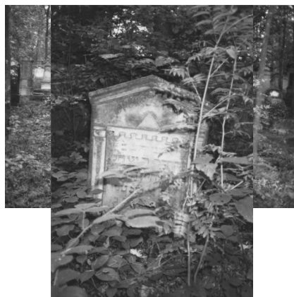
Jüdischer Friedhof Memmelsdorf.