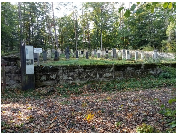
Memmelsdorf, jüdischer Friedhof, Gesamtansicht mit Umfassungsmauer (Aufnahme 2022)

Der jüdische Friedhof liegt an einem Berghang südwestlich des Ortes im Wald, ca. 2,5 km vom Ort entfernt in Richtung Wiesen. Er hat eine Größe von über 3300 qm und wurde 1835 angelegt. Es sind etwa 112 Grabsteine erhalten. Die letzte Beerdigung war im November 1937.