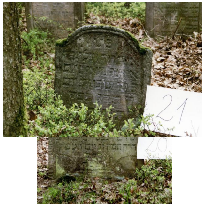
Jüdischer Friedhof Memmelsdorf.