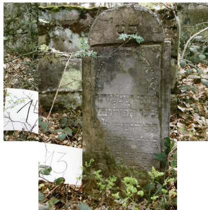
Jüdischer Friedhof Memmelsdorf.