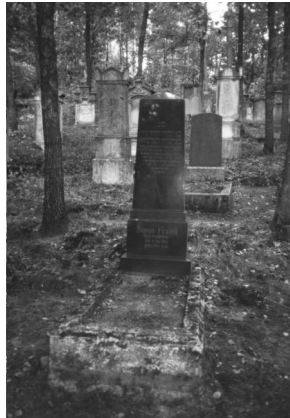
Jüdischer Friedhof Memmelsdorf.