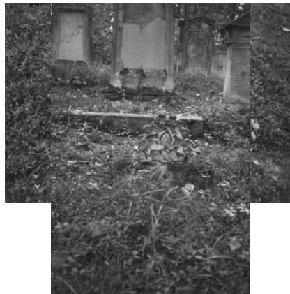
Jüdischer Friedhof Memmelsdorf.