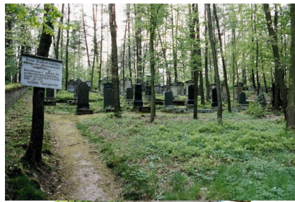
Jüdischer Friedhof Memmelsdorf.