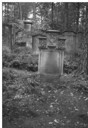
Jüdischer Friedhof Memmelsdorf.