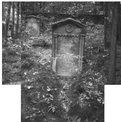
Jüdischer Friedhof Memmelsdorf.