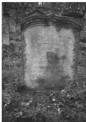
Jüdischer Friedhof Memmelsdorf.