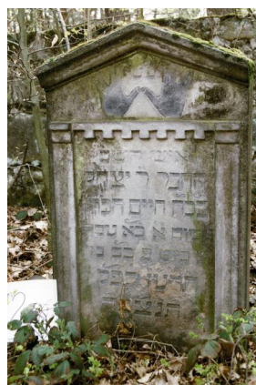
Jüdischer Friedhof Memmelsdorf.