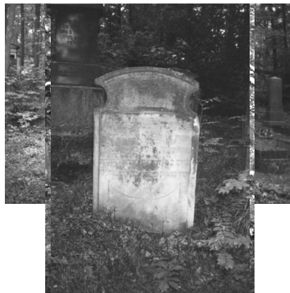
Jüdischer Friedhof Memmelsdorf.