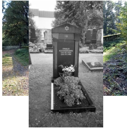
Memmelsdorf, jüdischer Friedhof, Gesamtansicht mit Umfassungsmauer (Aufnahme 2022)

Israel Schwierz hat uns großzügig die Originalfotoserien zu seiner 1988 erschienenen Dokumentation "Steinerne Zeugnisse jüdischen Lebens in Bayern" zur Verfügung gestellt. Dafür gilt ihm unser großer Dank. Diese Fotografien stellen gerade im Hinblick auf die in vielen Fällen in den letzten 25 Jahren sehr rasch fortgeschrittene Verwitterung der Grabsteine eine wertvolle Quelle dar.