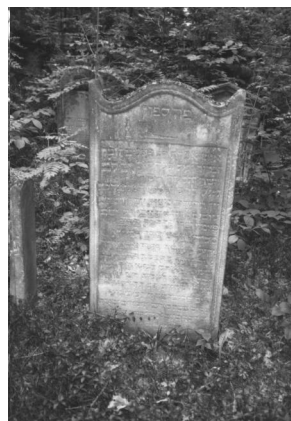
Jüdischer Friedhof Memmelsdorf.