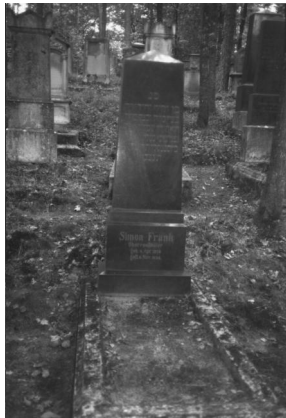
Jüdischer Friedhof Memmelsdorf.