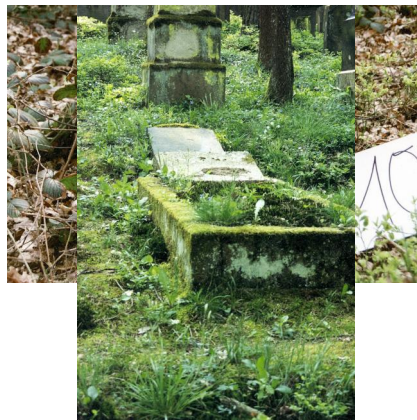
Jüdischer Friedhof Memmelsdorf.