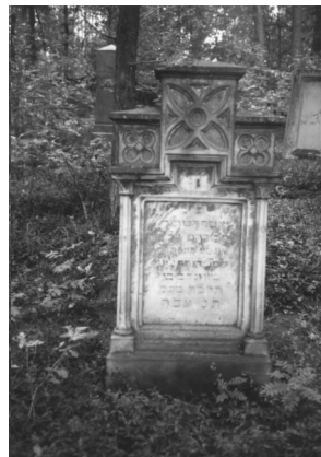
Jüdischer Friedhof Memmelsdorf.