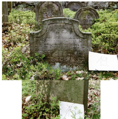
Jüdischer Friedhof Memmelsdorf.