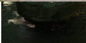
Jüdischer Friedhof Lisberg, 1981.